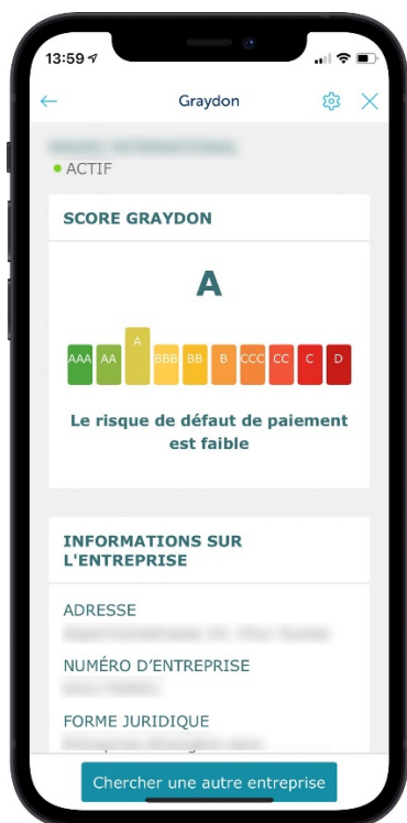
Fig1 : rating Graydon