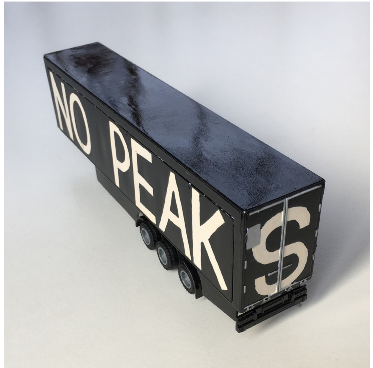
Pieterjan Ginckels, ‘NO PEAKS (TRUCK)’

“Onze levens zijn hyperreëel; we voelen voortdurend de nood om onze eigen identiteit te pimpen, te remixen, te herformuleren,” zegt Pieterjan Ginckels. “Daarom positioneer ik me als een soort ingebedde buitenstaander, die speelt met tegenstrijdigheden in snelheid en authenticiteit.” “Ginckels’ oeuvre gaat over het aan ons voorbijrazende moderne leven. Die versnelling verbeeldt hij in tentoonstellingen en ervaringen waar kunst, architectuur, ontwerp, en alles daartussenin, met elkaar versmelt.” (ICON Magazine, ‘Future 50,’ 2013)