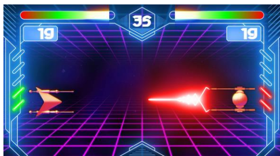
2 Beat Boeva