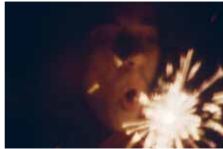
Wynne Greenwood, Jar the Beginning of Something , 2004, still. Vivienne Dick, Guerrillera Talks , 1978, still

M Reflections without Sun is een compilatie van kortfilms door pioniers van de experimentele film. Die kunstenaars gebruiken het medium film niet om verhalen te vertellen maar onderzoeken de notie 'performance' en 'staging' voor het oog van de camera. De directe en soms overdreven performances zorgen voor een verbazend effect en dwingen de toeschouwer uit zijn louter beschouwende rol. Overgeconstrueerde mise-en-scène 's en verkleedpartijen worden afgewisseld met meer intieme, reflectieve scènes. De esthetiek varieert van jaren 50-kitsch over punk tot hedendaagse stijlen.