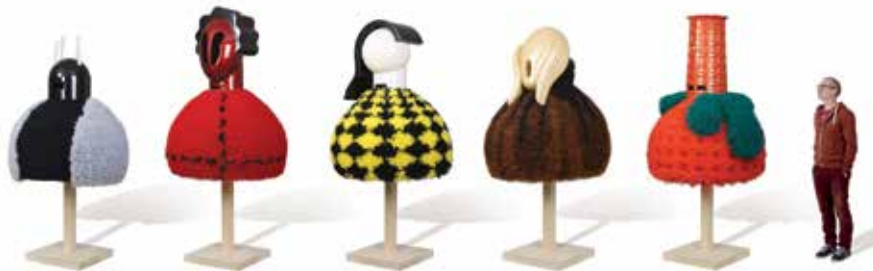
La Parade Moderne