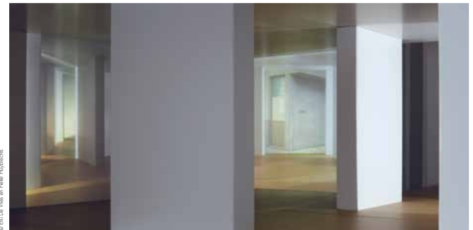
© Erki De Vries en Pieter Huybrechts

CONCEPT EN REALISATIE Erki De Vries en Pieter Huybrechts MET STEUN VAN de Vlaamse Gemeenschap WWW.BOOKPROJECT.EU