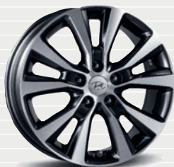
Launch senza pack ECO Launch Plus (tutte le versioni) 225/45 R17