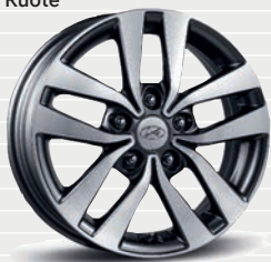
Launch con pack ECO