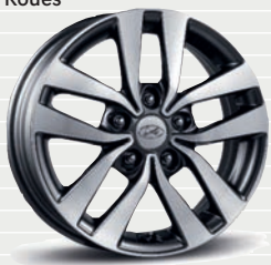
Launch avec pack ECO