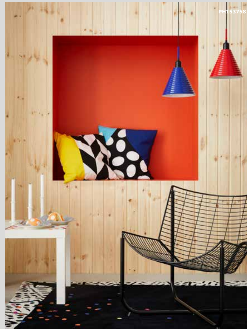
FÄRGSTARK tapis, poils ras 269,- 200×200 cm. 904.251.60 RÅANE fauteuil 59,- 304.177.33 MOSAIKBLAD housse de coussin 4,99/pce. Jaune/noir. 504.274.63 Bleu/noir. 904.274.61