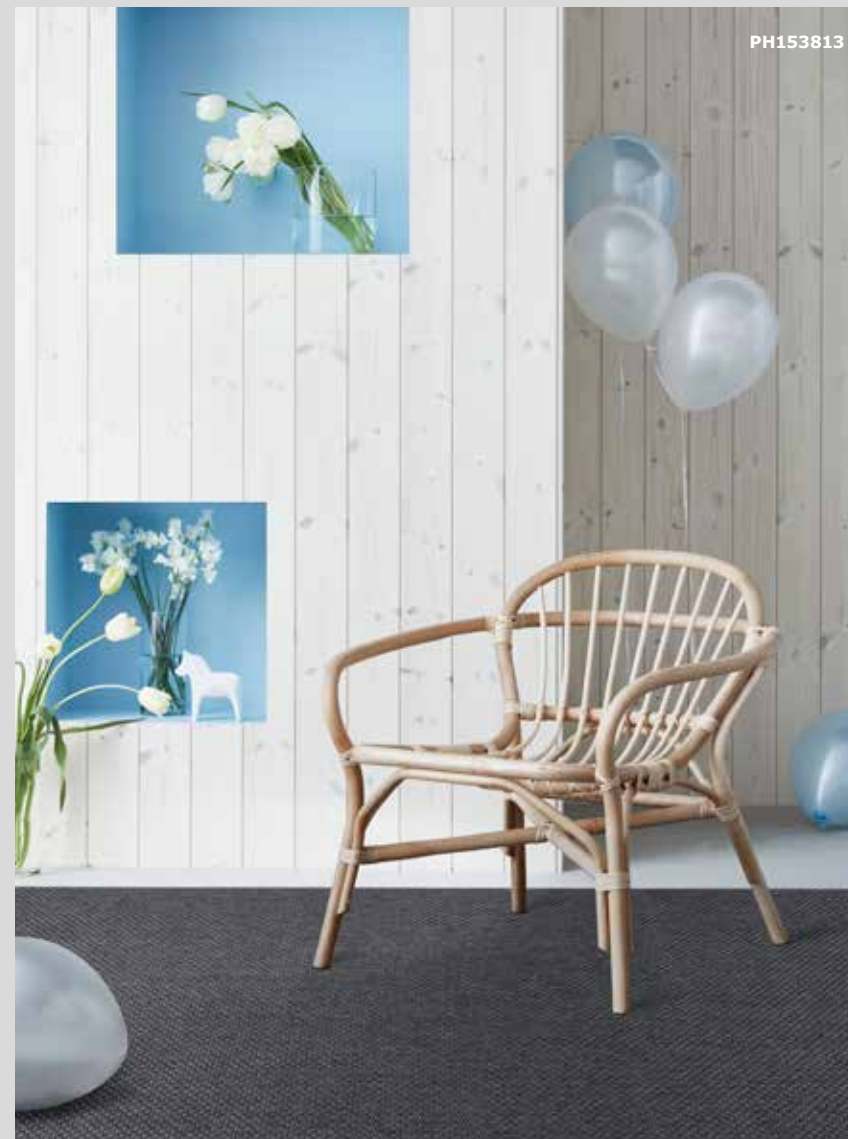
ALBACKEN fauteuil 69,90 304.304.14