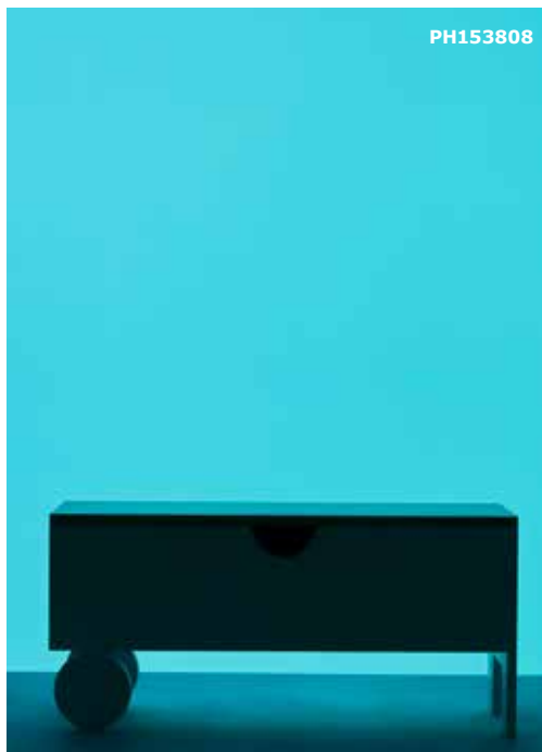
IKEA PS 1995 banc avec rangement 99,90 604.309.88