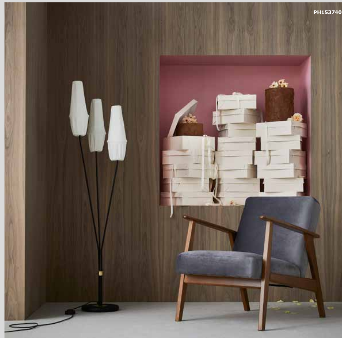
EKENÄSET fauteuil 229,- Velours gris foncé. 604.266.46 KNÄSJÖ lampadaire 99,90 402.774.78

Le lampadaire KNÄSJÖ, lancé en 1958 sous le nom de TRINETT, était selon l'expression de l'époque "super moderne". Six décennies plus tard, il ne l'est peut-être plus, mais ses abat-jour affichent toujours un design unique. Les changements? Les abat-jour, auparavant de différentes couleurs, sont désormais tous blancs. Et bien sûr, des ampoules LED, nettement plus favorables à l'environnement.