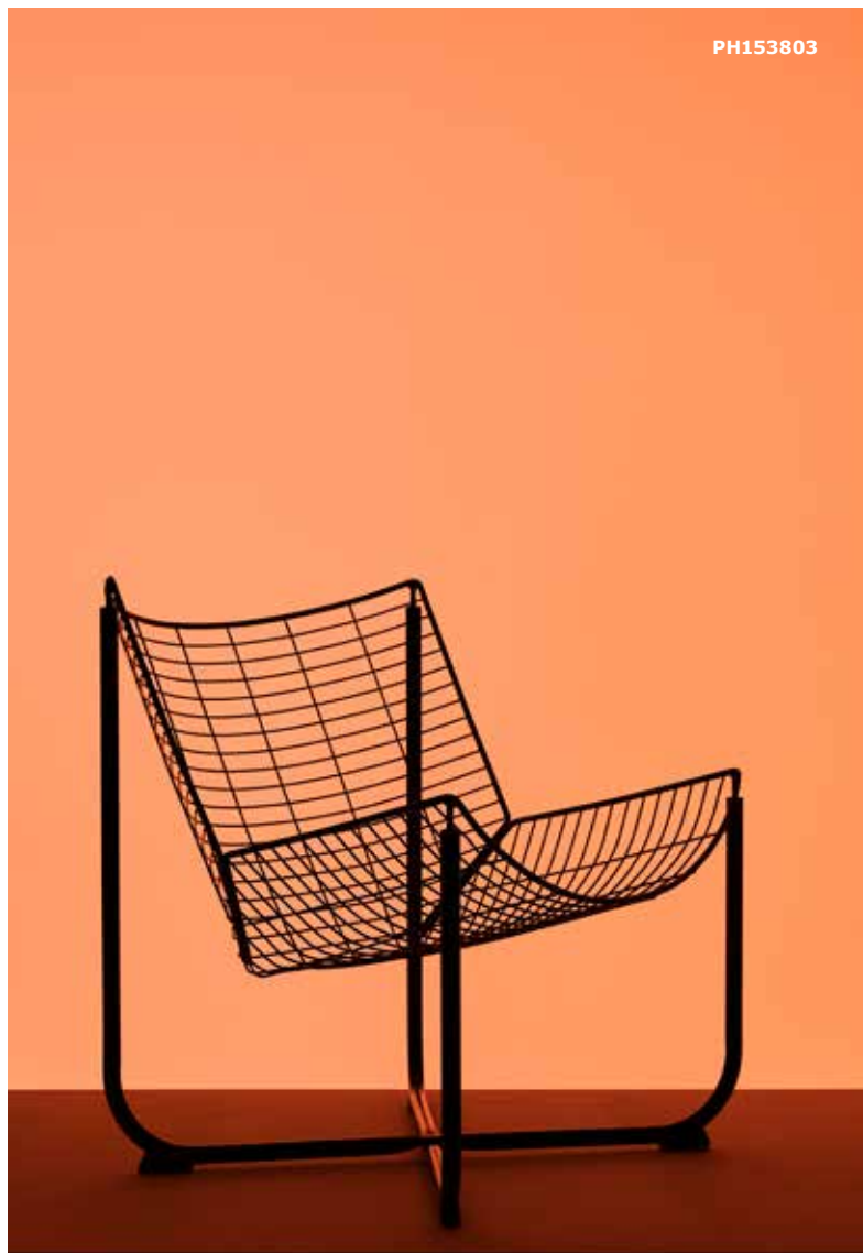
RÅANE fauteuil 59,- 304.177.33