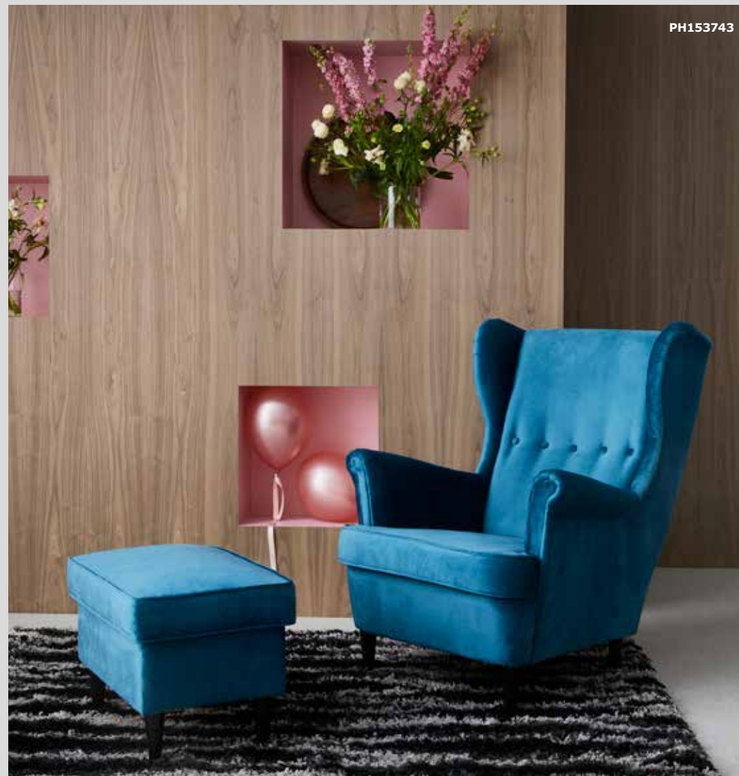
STRANDMON fauteuil à oreilles 229,- Velours turquoise. 704.266.55 STRANDMON repose-pieds av rangement 99,90 Velours turquoise. 004.266.73

Le fauteuil STRANDMON était l'un des favoris d'Ingvar Kamprad. Aujourd'hui, il se pare d'un nouveau coloris.