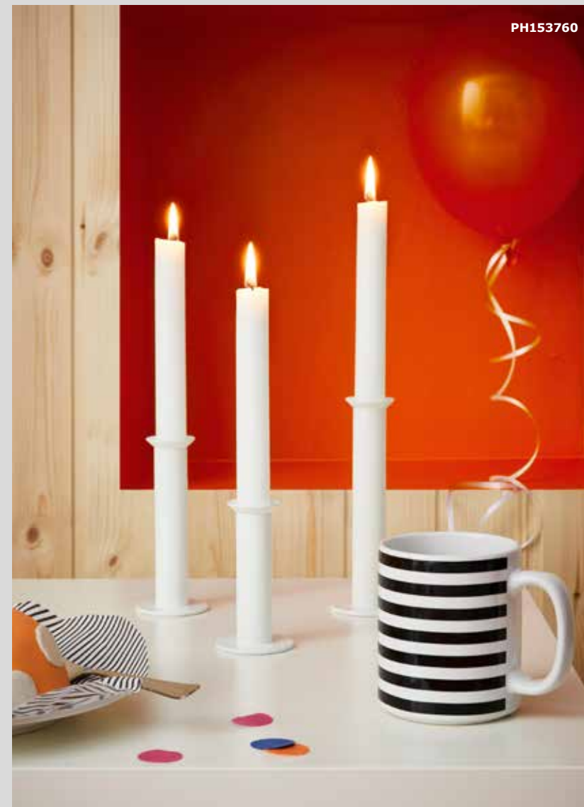
MORGONDOFT mug 1,99/pce. 304.280.91 FÄRGSTARK tapis, poils ras 269,- 200×200 cm. 904.251.60