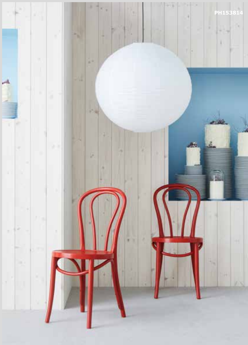
BJURÅN chaise 69,90/pce. 404.224.42 SJUTTIOFEM abat-jour suspension 9,90 Monture électrique vendue séparément. 204.287.32

La chaise BJURÅN, initialement connue sous le nom d'ÖLGA, fut lancée, en noir, en 1961. Elle est toujours fabriquée par la même usine en Pologne où le bois massif est encore cintré de façon artisanale. Une pièce emblématique, aussi belle autour d'une table qu'utilisée seule pour ajouter une touche de couleur.