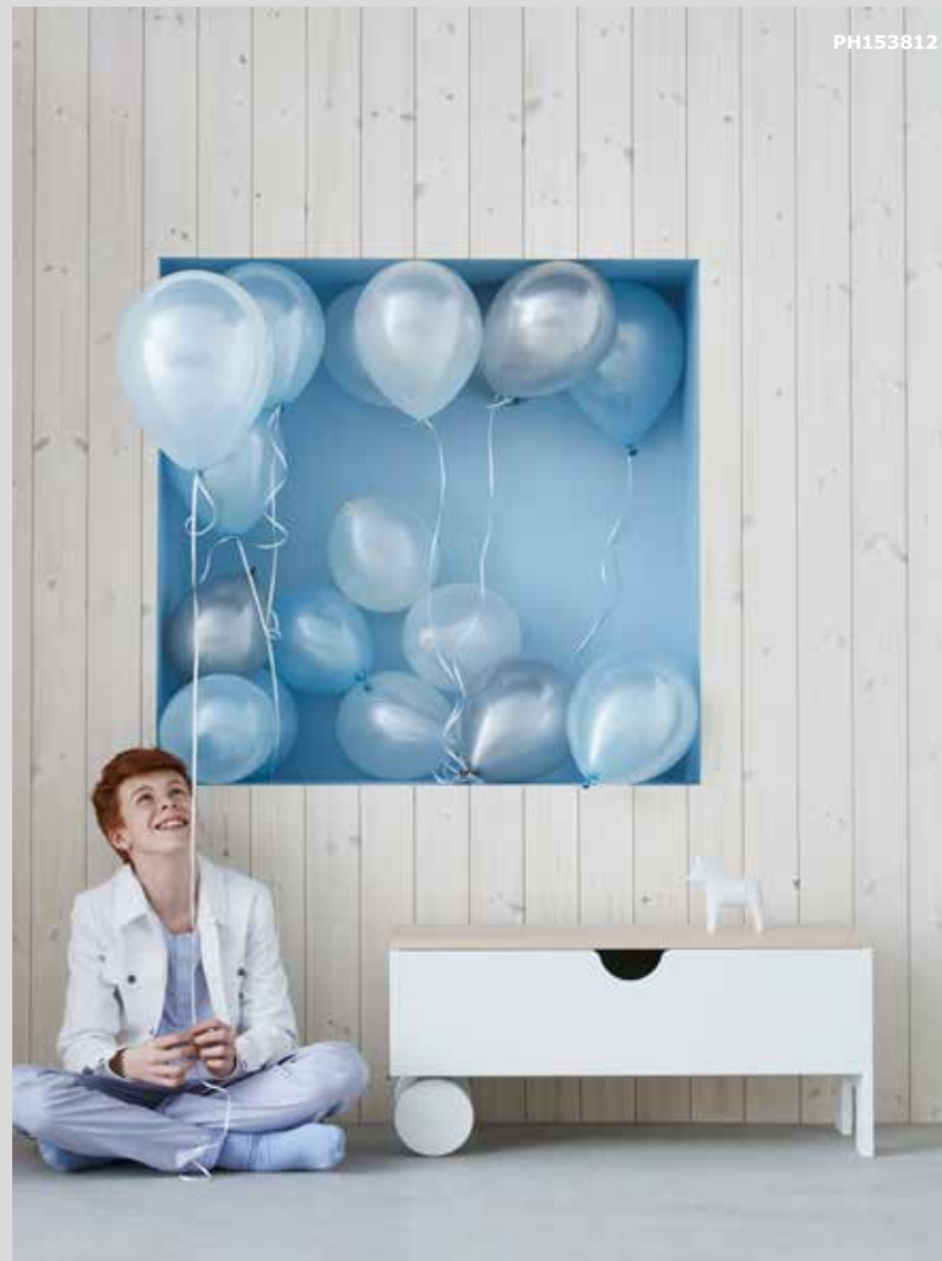
IKEA PS 1995 banc avec rangement 99,90 604.309.88 FINANSIELL décoration, cheval 9,99 Blanc. 004.341.40