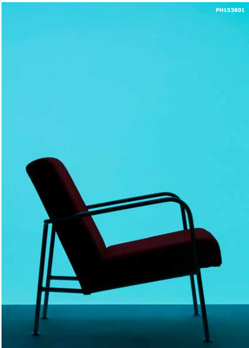
IKEA PS 1999 fauteuil 149,- 704.305.82