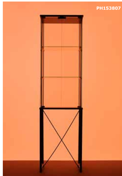
FÄRGSTARK vitrine 79,90 804.159.82