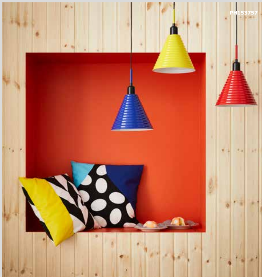
MOSAIKBLAD housse de coussin 4,99/pce. Jaune/noir. 504.274.63 Bleu/noir.904.274.61 FÄRGSTARK suspension 29,99/pce. Bleu. 703.995.34 Jaune. 103.995.32 Rouge. 303.995.31