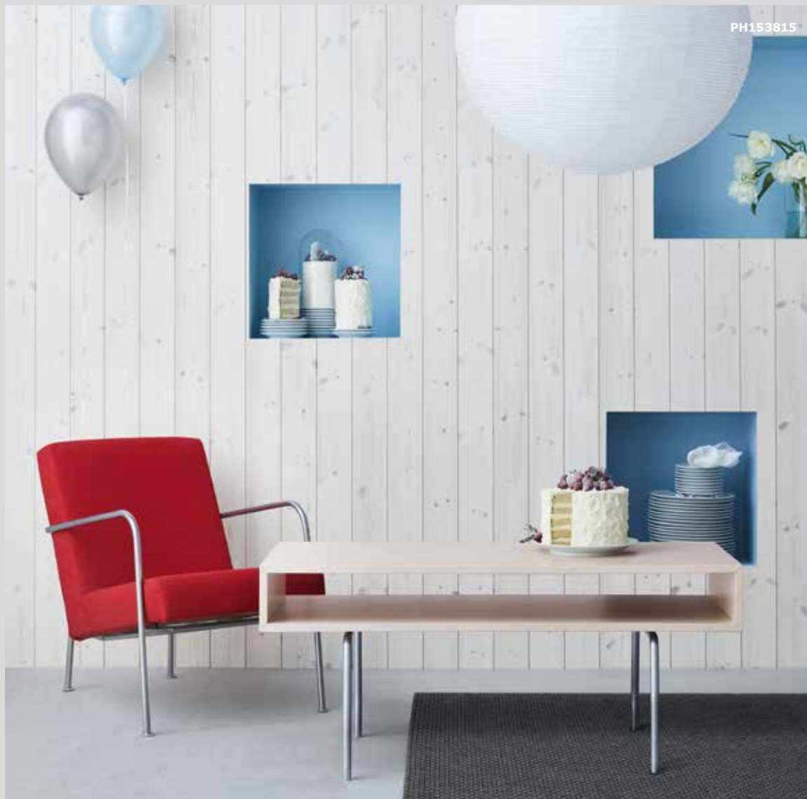
IKEA PS 1999 fauteuil 149,- 704.305.82 IKEA PS 1995 table basse 89,90 904.302.46