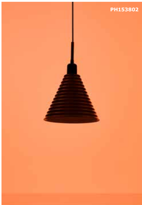
FÄRGSTARK suspension 29,99 Bleu. 703.995.34