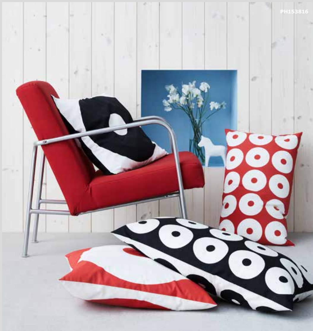
IKEA PS 1999 fauteuil 149,- 704.305.82 SIPPRUTA housse de coussin 4,99/pce. 50x50 cm. Noir. 104.371.38 Rouge. 904.371.39 SIPPRUTA housse de coussin 5,99/pce. 65x40 cm. Rouge. 504.371.41 Noir. 304.371.37

Les textiles SIPPRUTA ont été conçus pour la première collection IKEA PS lancée en 1995. L'idée était de créer une base de textiles pour la collection, composée de motifs classiques et intemporels. Les nouvelles housses de coussin transforment instantanément l'ambiance d'une pièce.