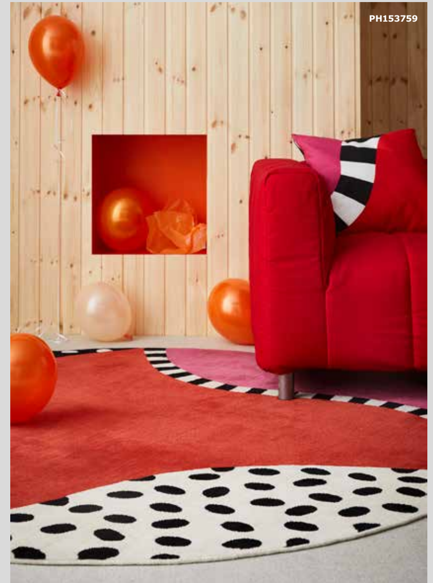
FÄRGSTARK tapis, poils ras 249,- Ø200 cm. 304.251.58 MOSAIKBLAD housse de coussin 4,99 Rouge/noir. 704.274.62