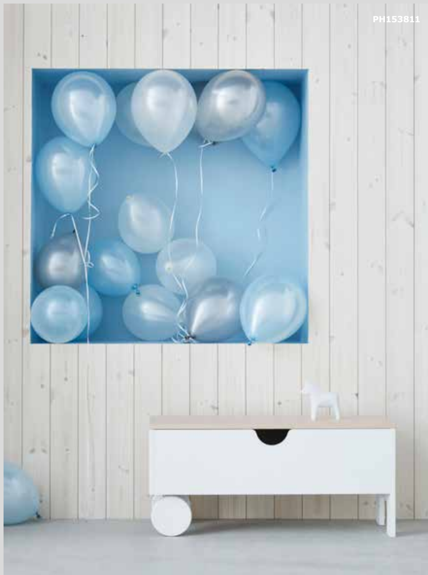
IKEA PS 1995 banc avec rangement 99,90 604.309.88 FINANSIELL décoration, cheval 9,99 Blanc. 004.341.40

Le banc IKEA PS faisait partie de la première collection IKEA PS, lancée en 1995. 'PS' pour 'post-scriptum' -ce qu'on ajoute à ce qu'on a déjà écrit-. En d'autres termes, ce nom symbolise la volonté de IKEA d'ajouter quelque chose à son offre. Une envie d'explorer et de revisiter le design scandinave moderne pour voir à quoi il pouvait aboutir.