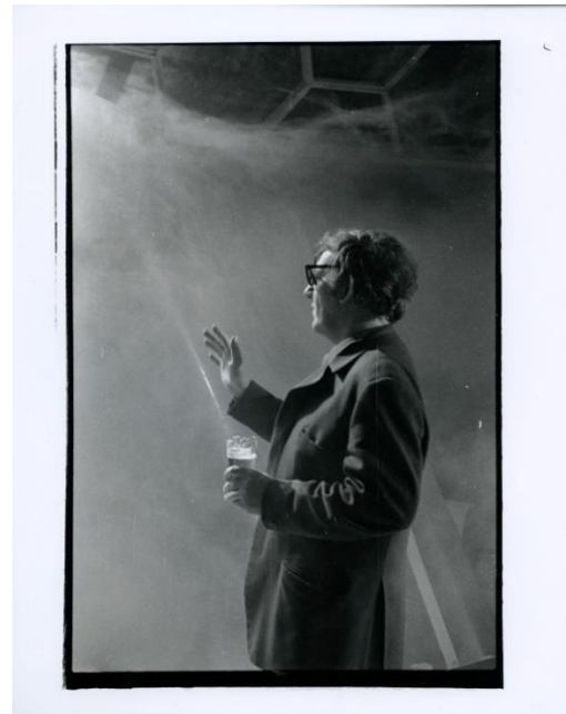
Hugo Claus in het Paleis voor Schone Kunsten, Brussel, mei 1968.