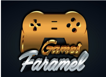
Mohamad A. Faramel Games

Crazygames heeft een duurzame band met een dertigtal onafhankelijke developers over de hele wereld. Ze zijn essentieel voor het succes van CrazyGames.