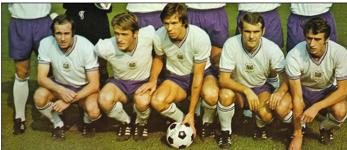
Anderlecht 1972 met Jean Dockx, Paul Van Himst, Jan Mulder, Jan Verheyen en Robbie Rensenbrink