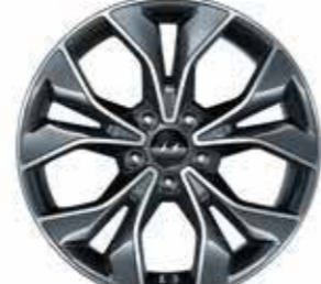
Jante en alliage 18"