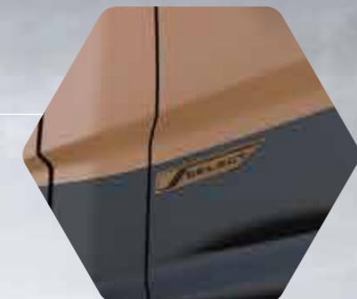
Select Speciaal logo