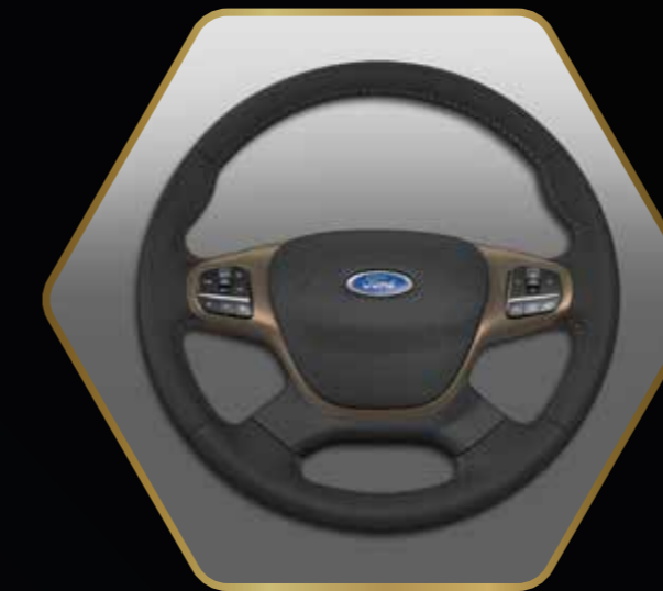
Stuurwiel met bronzen details