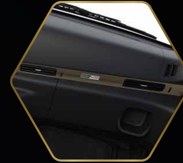
Bronzen Decopart & Select serienummer