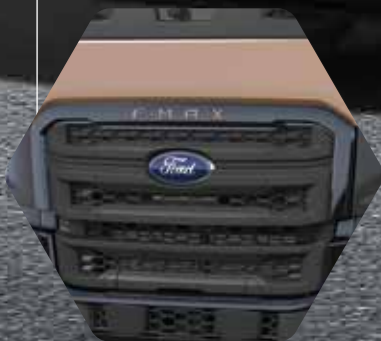
Bronz metallic F-MAX-badge