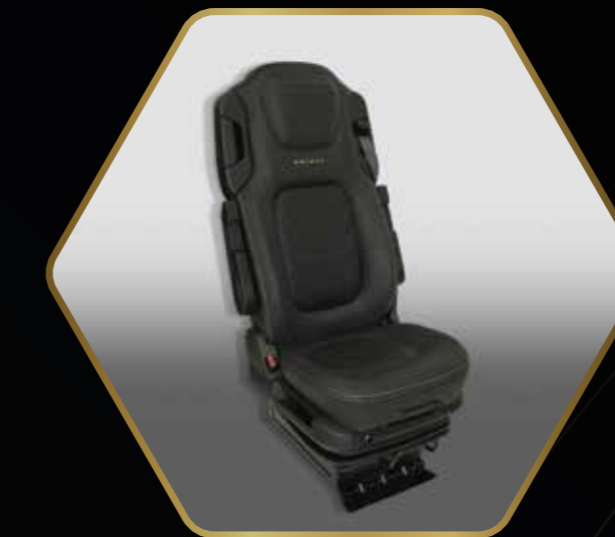
Select stoelen met bronzen details