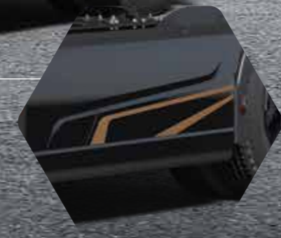
Bronzen zij-Skirt Details