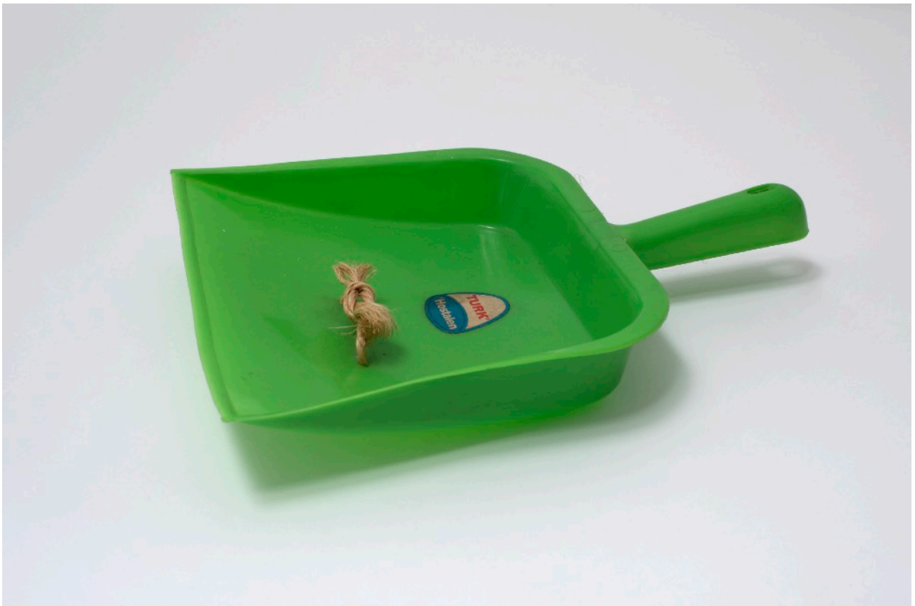
René Heyvaert, Zonder titel, 1979, Cera-collectie/M-Museum Leuven