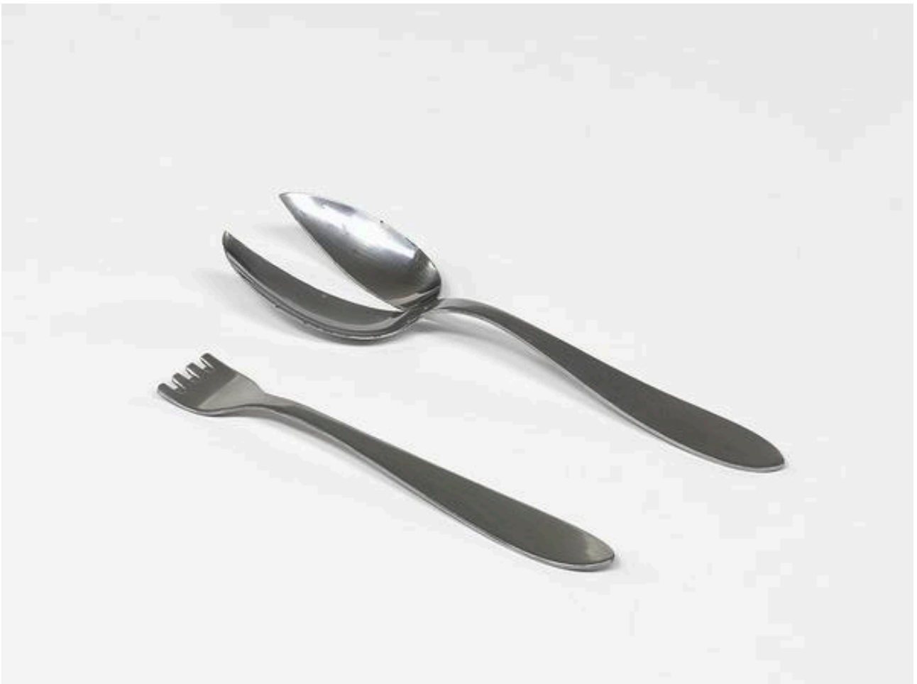
René Heyvaert, zonder titel, 1979, Cera-collectie/M-Museum Leuven