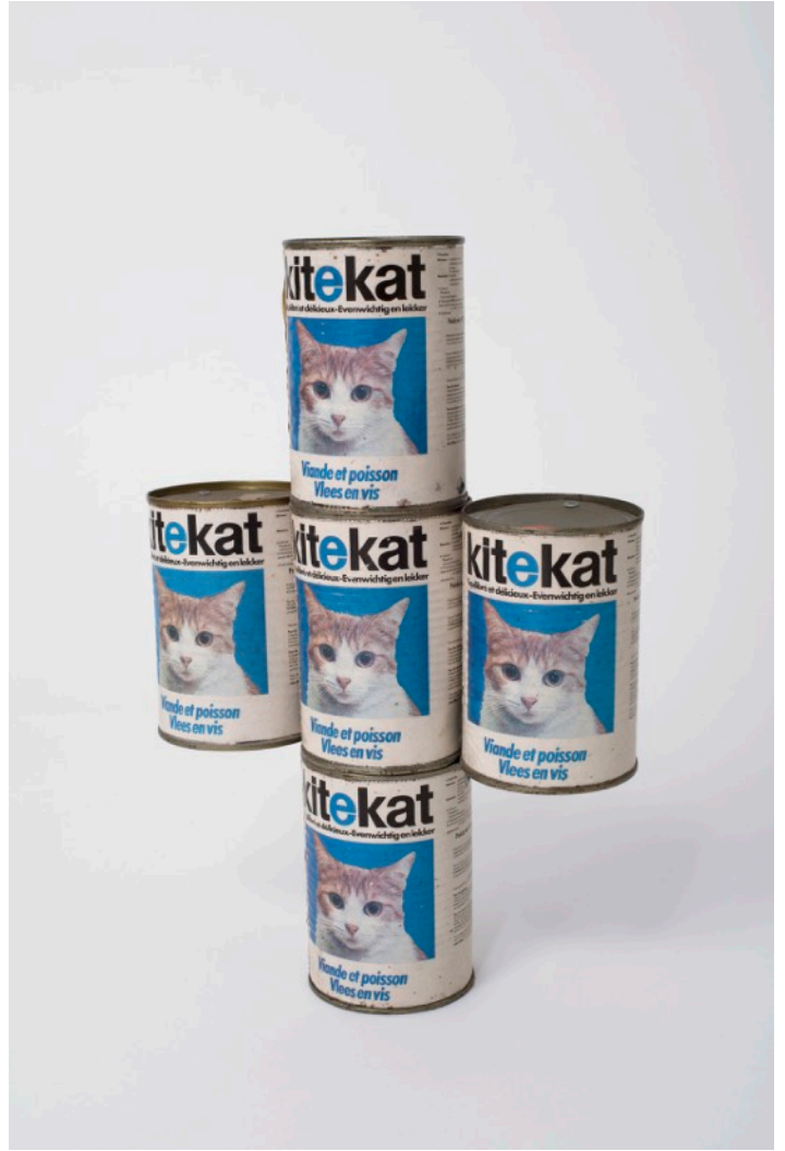
René Heyvaert, Zonder titel, 1982, privécollectie