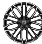
22 pouces en alliage léger forgé avec étriers de frein à quatre pistons (Standard Privilege AWD)