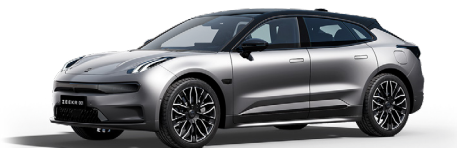
Tech Grey (Option)