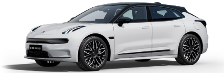
Crystal White (Standard)