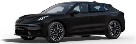
Phantom Black (Option)