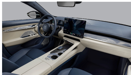
Sellerie Midnight Blue & Polar White (Option Privilege AWD)

Consommation d'énergie combinée du Zeekr 7GT en kWh/100 km : 16,6 - 19,8 (WLTP), émissions de CO 2 combinées en g/km : 0, consommation de carburant combinée en l/100 km : 0. Les chiffres sont basés sur l'homologation WLTP. L'autonomie électrique est influencée par des facteurs incluant, mais sans s'y limiter, le style de conduite et les conditions routières. Les temps de charge peuvent varier en fonction de la puissance fournie.