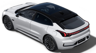
Toit noir contrasté (De série sur Privilege AWD, option Performance AWD)