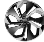
21 pouces Arc Phantom en métal léger (Standard Long Range RWD)