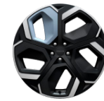
22 pouces en alliage léger Energy avec étriers de frein à quatre pistons (Standard Performance AWD)