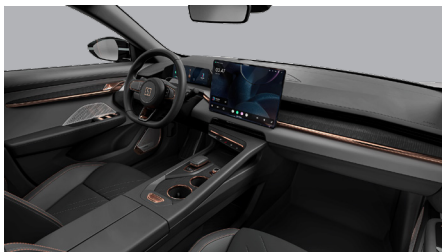
Sellerie Charcoal Black & Stone Grey (Standard)