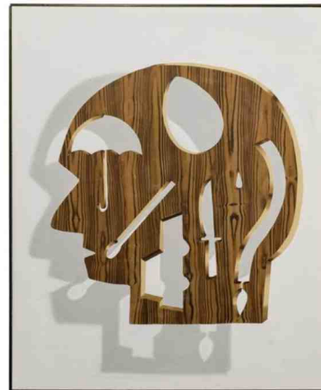
Opvallend zijn de pictogrammen.

satie. Ik vind het heel leuk om alles te ordenen.’