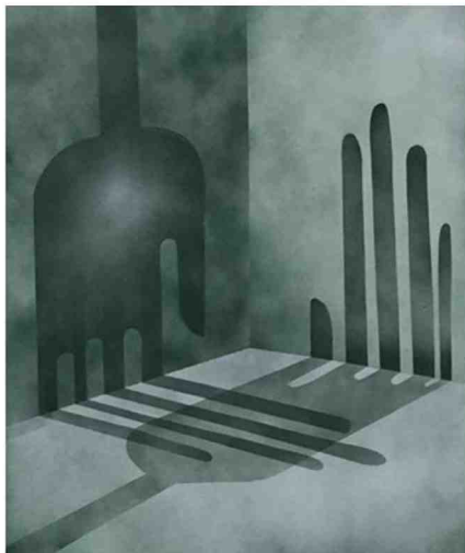
Het winnende werk 'Get home'.