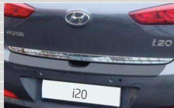
Listello cromato per portellone posteriore