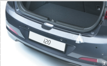
Protezione soglia di carico