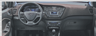
Vertex Cappuccino ‡