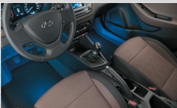
Illuminazione del vano piedi LED blu