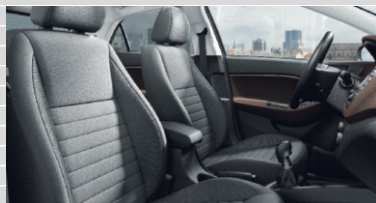
Vertex Pelle nera