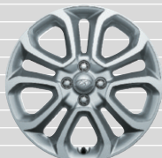
Vertex 205/45 R17