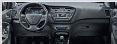
Vertex Comfort Grey