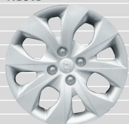
Origo 185/65 R15