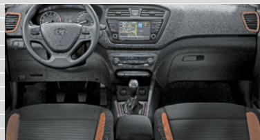
Amplia Tessuto nero/arancione Comfort Grey