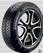
Ruote d'inverno Continental su cerchi in lega leggera 16" con TPMS