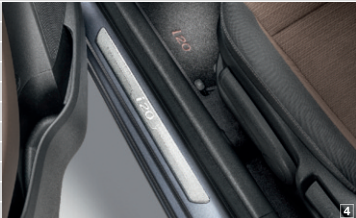
Listelli sottoporta in alluminio