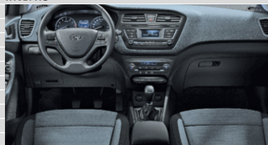
Origo Tessuto Grey Blue