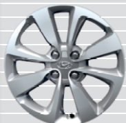
Amplia 195/55 R16