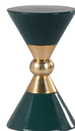
DÉCO TRIANGULO PM Fer 45,99 €