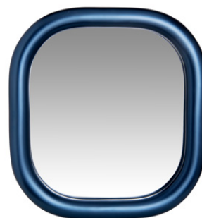
MIROIR DIONE Miroir 69,99 €