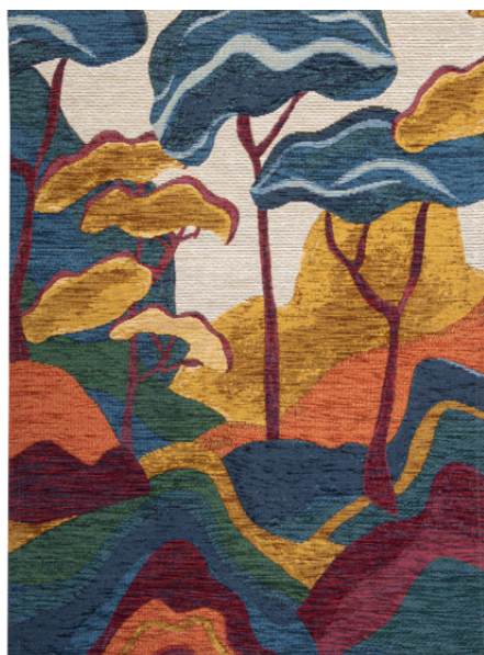
DÉCO MURALE NEREID Acrylique 59,99 €