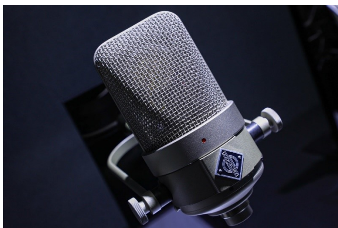
M 49 V 麦克风