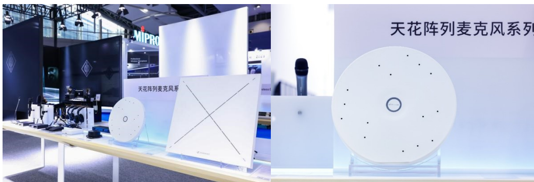
森海塞尔商务通讯产品 | TCC M 天花阵列麦克风

森海塞尔商务通讯展出了包括 TCC 2 、 TCC M 天花阵列麦克风在内的数款产品，致力于使协作和学习更轻松。全新 TCC M 天花阵列麦克风拥有备受市场认可的 TCC 2 的所有创新技术和功能，为中型会议室和教室提供同样优质无忧的音频体验。