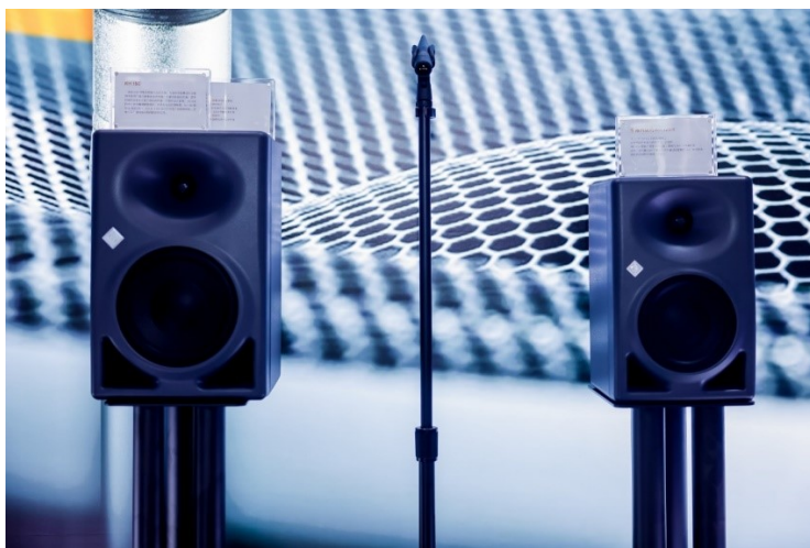
KH 150 (左), MA 1 (中), KH 120 II (右)

MT 48 是诺音曼推出的首款音频接口，也是诺音曼与 Merging Technologies 携手打造的第一款产品。 MT 48 是一款在音质、功能和易用性上都表现卓越的产品，同时，它也标志着诺音曼的产品品类从麦克风、音箱及耳机，拓展到数字领域，实现了从输入到输出的全链路参考级诺音曼品质。