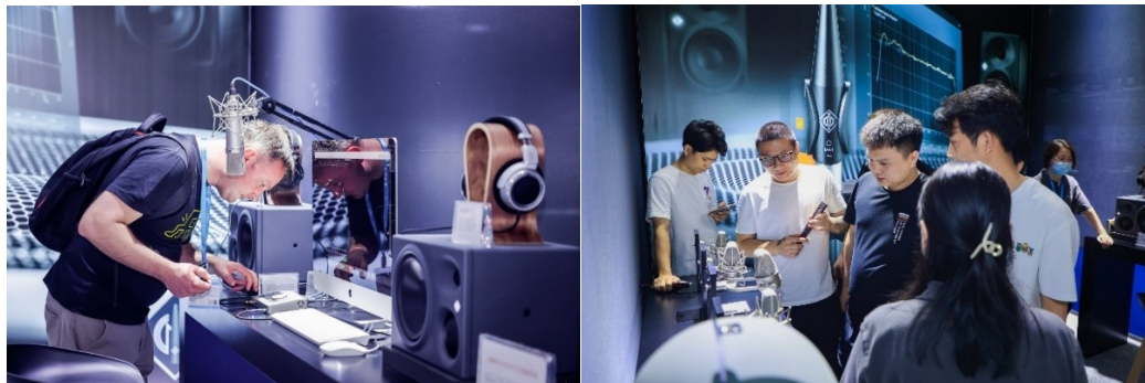
诺音曼展区反响热烈

随着现场演出、电影及音乐制作等市场的复苏，专业音频行业正焕发蓬勃生机。作为行业引领者，森海塞尔及诺音曼将持续致力于不断开拓先进技术，以更多前沿可靠的音频产品及解决方案为用户创造独特的声音体验，打造音频之未来！