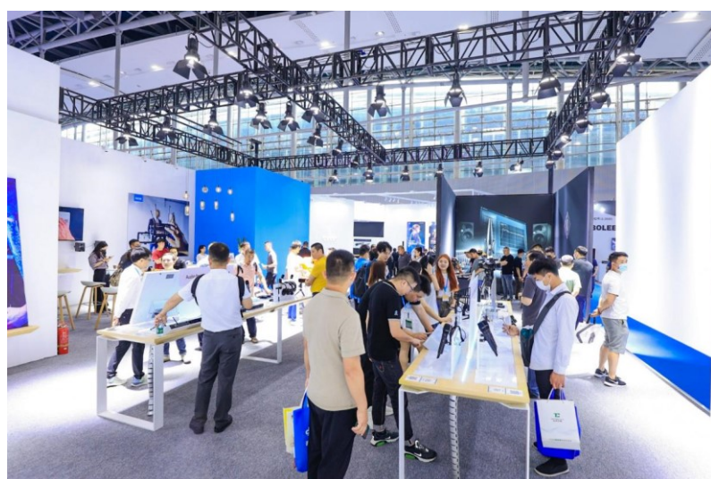
森海塞尔展位的参观者络绎不绝