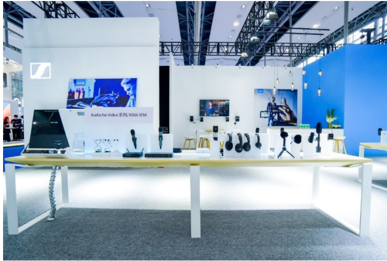
森海塞尔 Audio for Video 系列、XSW-IEM 无线耳返系统及 HD PRO 系列监听耳机