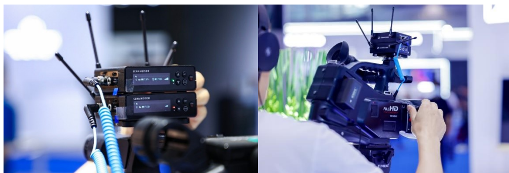
EW-DP 全数字 UHF 无线麦克风系统

此次展会，森海塞尔展示了多款革新性产品，将先进技术和易用性相结合，助力内容创作者、电影制作人及广播电视行业用户拥有可靠优质的音质和轻松的工作流程。