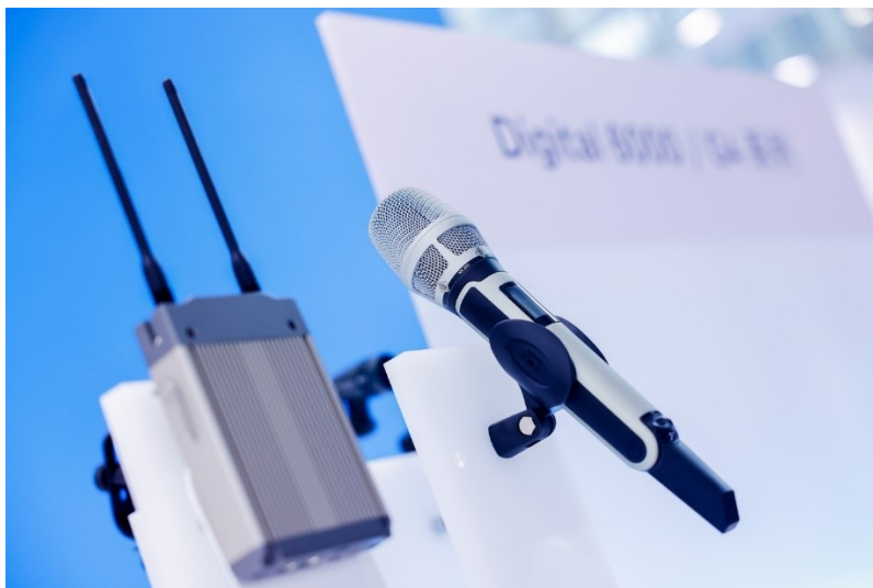
Digital 9000 系列

此外，森海塞尔还为广大参会者带来了包括 Digital 6000/9000 在内的多款适用于广播电视、现场演出、vlog 拍摄等各类应用场景的麦克风系统和监听耳机产品。