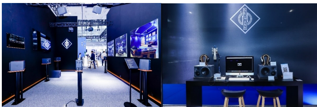
诺音曼现场打造的 7.1.4 沉浸音系统和个人音乐工作室设置

KH 150 与其他诺音曼监听音箱同样采用了高分辨率高音扬声器，同时内置了具有超低失真、高声压级的全新 6.5 英寸低音扬声器，适用于从广播到音乐制作的所有应用。在上一代产品的成功基础上， KH 120 II 配备了全新开发的低音单元设计，并在所有声学参数方面都有进一步提升，可以完美适应任一声学环境的性能。