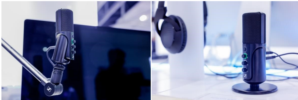
Profile USB 麦克风

EW-DX 继承了 Evolution Wireless Digital 系列的优良特性，具有 1.9 毫秒超低延迟、等距分布和 134 dB 超宽输入动态范围等优点，能够自动分配频率，功能更加丰富出色。用户只需一键启动 RF 环境扫频，即可实现多通道规划，避免调制干扰。