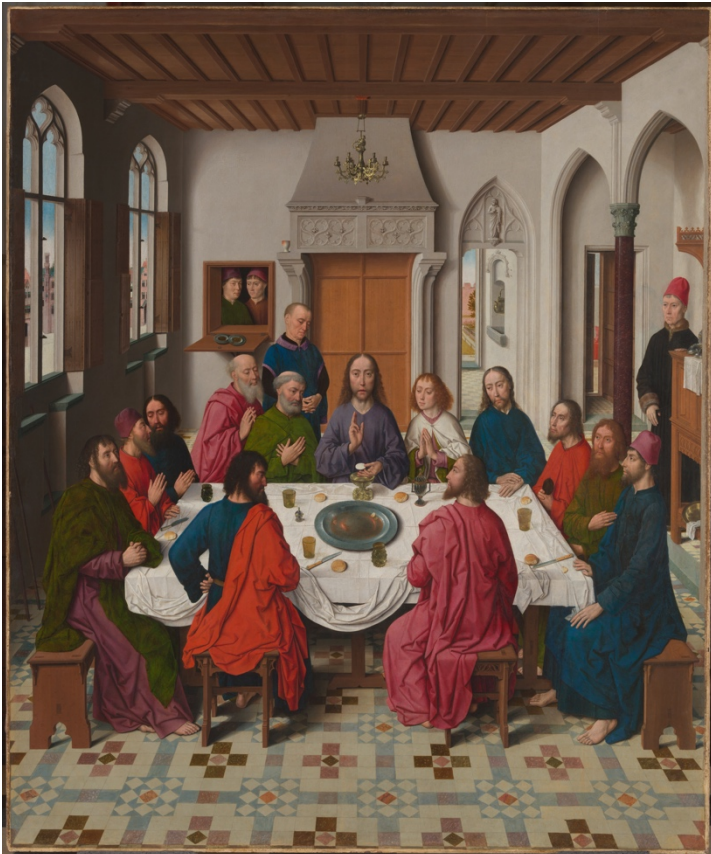
'Het Laatste Avondmaal (centrale paneel)', Dieric Bouts, 1464-1468, M Leuven / Sint-Pieterskerk

Soms staat er wat er staat. De methode van de symbolische lezing is zo ingeburgerd geraakt, dat we in de val dreigen te lopen om elk glas en elk decorelement te interpreteren als iets anders. Bouts werd bijgestaan door theologen om zijn wereld vorm te geven, dus veel van zijn decorstukken zijn absoluut geladen met een dubbele bodem. Maar het is een verademing om hem ook door een andere bril te bekijken: die van de schilder die voorwerpen en gebruiken weergeeft zoals ze er in zijn tijd uitzagen, enkel en alleen om een (voor toen) hedendaagse sfeer te scheppen.