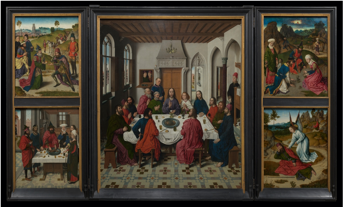
'Triptiek met het Laatste Avondmaal (centrale paneel)', Dieric Bouts, 1464-1468, M Leuven / Sint-Pieterskerk

De 'grand finale' van de tentoonstelling is Het laatste avondmaal van Dieric Bouts. Levenaars kennen het van in de Sint-Pieterskerk, de kerk waarvoor het altaarstuk ook oorspronkelijk geschilderd is. Voor deze tentoonstelling verhuist Bouts' magnum opus tijdelijk naar M Leuven. Dit is namelijk het orgelpunt waarin al de vorige lijnen samenkomen.