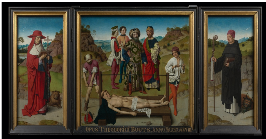
‘Triptyk met de marteling van de heilige Erasmus’, Dieric Bouts, ca. 1460-1464, M Leuven / Sint-Pieterskerk

Tot op vandaag geldt Dieric Bouts (ca.1410-1475) bij het brede publiek als een ‘Vlaamse Primitief van de tweede generatie’ of de ‘schilder van de stilte’. Zijn oeuvre is minder bekend dan dat van pionier Van Eyck en minder instagrammable dan de apocalyptische taferelen van Bosch. Deze tentoonstelling is een imposant eerherstel . Voor het eerst komen bijna twintig van Bouts’ werken samen in Leuven, de stad waar hij een groot stuk van zijn leven doorbracht en waar hij zijn beste panelen schilderde.