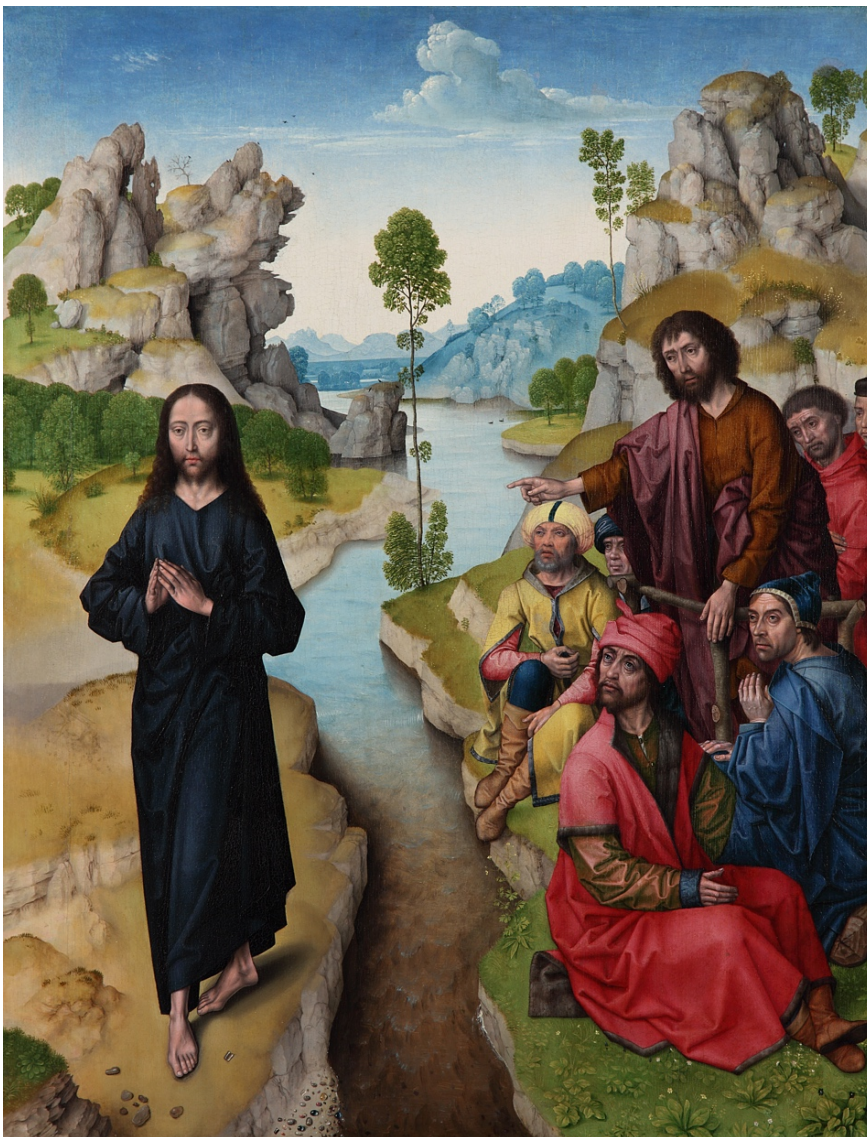
'De prediking van Johannes de Doper ('Ecce Agnus Dei')', Dieric Bouts (volger van), 1500-1520

Dieric Bouts is niet de uitvinder van de landschapsschilderkunst. Er zijn al prachtige voorbeelden te vinden van landschappen in het oeuvre van Jan van Eyck en Rogier Van der Weyden. Maar Bouts gaat absoluut een stap verder. Hij perfectioneert de visuele technieken om diepte te brengen in een landschap , technieken die ook in de rest van Europa verder school zullen maken en nog eeuwen lang tot de basisvaardigheden van elke klassiek geschoolde schilder zullen behoren.