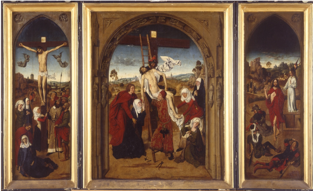
'Triptiek met de Passie van Christus', Dieric Bouts, 15e eeuw

Het volstrekt nieuwe gebruik van diepte in de Renaissance, zowel dankzij landschappen als het vluchtpuntperspectief, opent een vat van mogelijkheden. Voor het eerst ontstaat een toneel achter het kader van het schilderij, een scène die gevuld kan worden met personages, voorwerpen, interieurs – eigenlijk met eender wat. Waarvoor kiest Dieric Bouts?