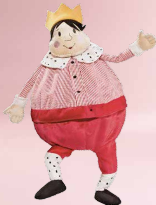
GULLGOSSE peluche, roi