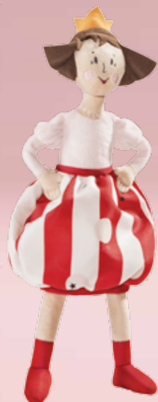
NOJSIG peluche, princesse