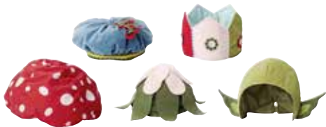
VITSIG chapeau enfant 3,99 Designer: Silke Leffler.