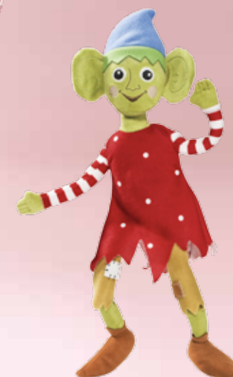
KRULLIG peluche, elfe