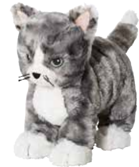
LILLEN peluche, chat 4,99