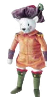
RIDDERLIG peluche, chat 7,99 Designer: Silke Leffler.