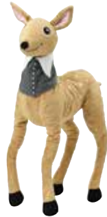
SÖTNOS peluche, cerf 9,99 Designer: Silke Leffler.