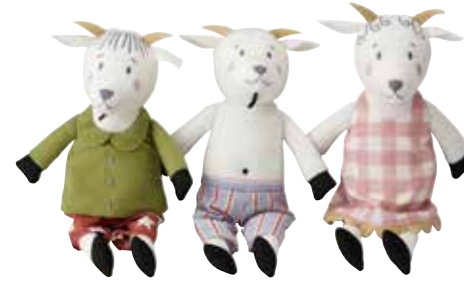
GETDJUR jouet d'éveil chèvres 2,99 Designer: Silke Leffler.