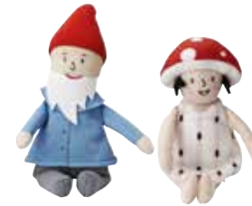
MINDRE peluche 1,49 Designer: Silke Leffler.