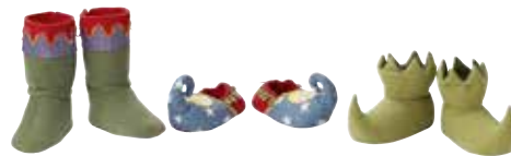
PIFFIG chaussure enfant 5,99 Designer: Silke Leffler.