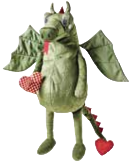
FLYGDRAKE peluche, dragon 9,99 Designer: Silke Leffler.