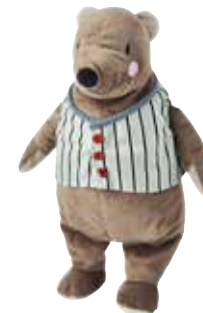
NALLEBJÖRN peluche, ours 7,99 Designer: Silke Leffler.