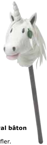
ROSENFINK cheval bâton licorne 9,99 Designer: Silke Leffler.