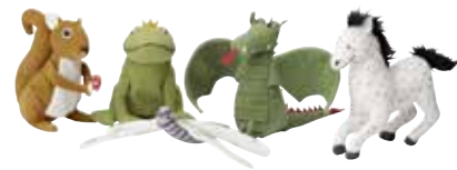
GULLEPLUT marionnette doigt 0,99 Designer: Silke Leffler.