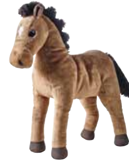
ÖKENLÖPARE peluche, cheval 4,99