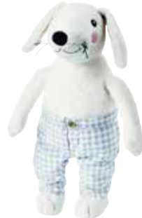
SKOGSHARE peluche, lapin 5,99 Designer: Silke Leffler.