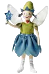
SÅNGTRAST peluche, fée avec baguette magique 4,99 Designer: Silke Leffler.