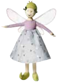
SILVERTÄRNA peluche, fée 4,99 Designer: Silke Leffler.