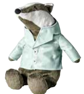
GRÄVLING peluche, blaireau 5,99 Designer: Silke Leffler.