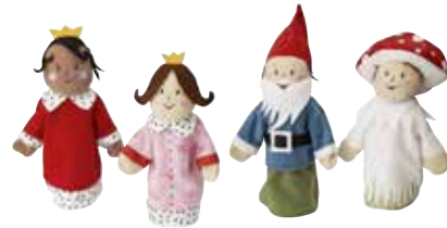
GLADLYNT marionnette, famille 3,99 Designer: Silke Leffler.