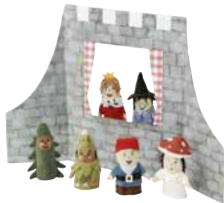
JÄTTELITEN marionnette doigt avec accessoires, multicolore 4,99 Designer: Silke Leffler.