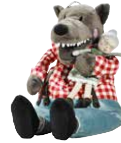
LUFSIG peluche, loup 9,99 Designer: Silke Leffler.