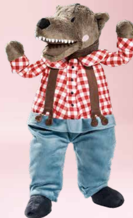
LUF SIG peluche, loup