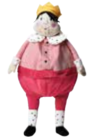
GULLGOSSE peluche, roi 5,99 Designer: Silke Leffler.