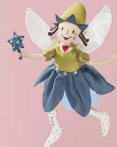
SÅNGTRAST peluche, fée

Cette année, cela fera 10 ans que IKEA organise sa campagne Peluches annuelle. Pour chaque peluche ou livre pour enfant acheté chez IKEA entre le 26 octobre et le 5 janvier, IKEA Foundation reversera 1 euro en faveur de la scolarisation des enfants les plus défavorisés, via l'UNICEF . Comme chaque année, cette action invite les clients à participer à la campagne Peluches afin de pouvoir contribuer au droit des enfants à l'éducation.