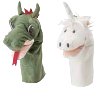
FANTASIVÄRLD marionnette 3,99 Designer: Silke Leffler.