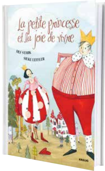
KRULLIG livre d'enfant prix IKEA FAMILY 3,99 prix normal 4,99 Designer: Silke Leffler.