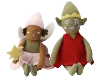
LILLEPYTT peluche 1,49 Designer: Silke Leffler.