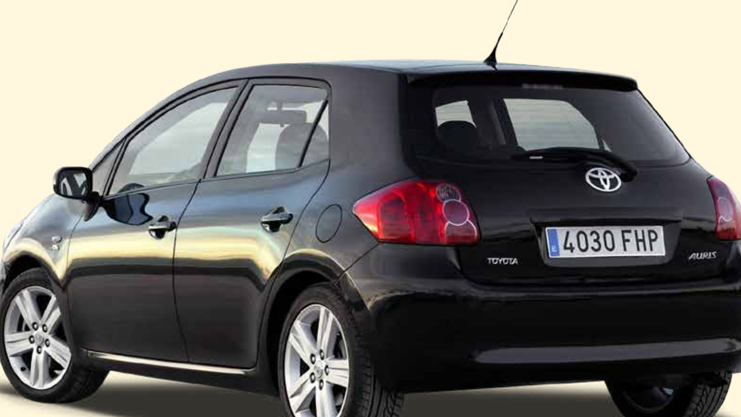
De Auris komt op de markt en vervangt de Corolla Hatchback

De maatschappelijke zetel en het administratieve centrum van Toyota Belgium verhuizen naar Zaventem. De Yaris hybride komt op de markt.