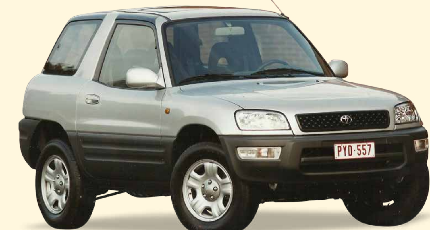
Toyota roept het SUV-segment in het leven door het model RAV4 op de markt te brengen