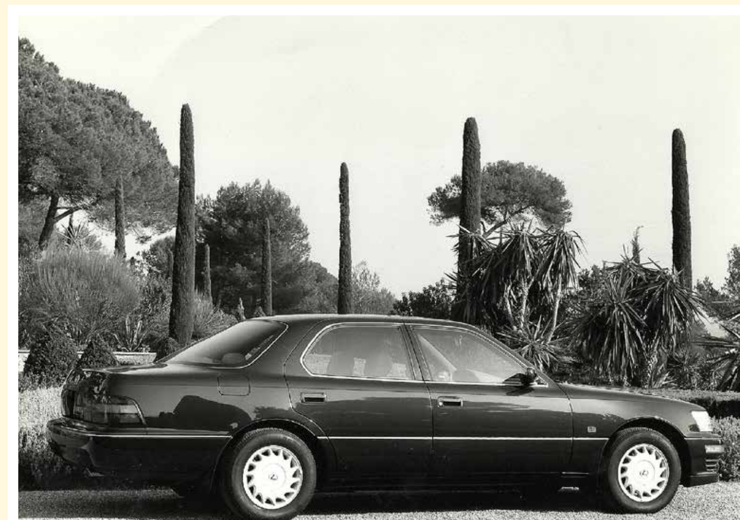
De hoogtechnologische berline Lexus LS400 komt op de markt

Inhuldiging van de nieuwe maatschappelijke zetel en het technische en administratieve centrum in Eigenbrakel (oppervlakte: 14.000 m 2 )