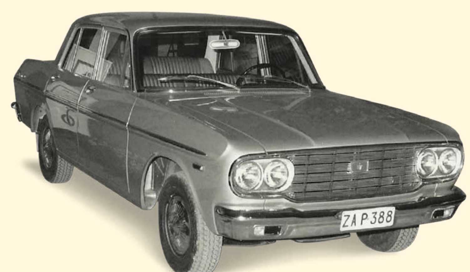
Joska Bourgeois importeert de eerste Toyota in België. Twee modellen worden voorgesteld: de Crown en de Corona