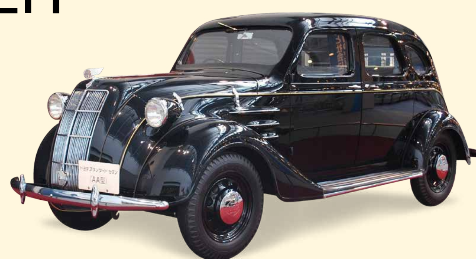
Toyota AA sedan (1936): allereerste personenautomodel

Bij de grootste autoconstructeur ter wereld neemt België een speciale plaats in. Sinds 1966 timmert Toyota letterlijk aan de weg in ons land. Vandaag is het Japanse merk een van de grootste werkgevers in de autobranche in België en zet het de toon met state-of-the-art hybride auto's. 8 op 10 van de full hybridewagens in België is een Toyota en 40% van de verkochte Toyota's is een hybride. Van een successstory gesproken!