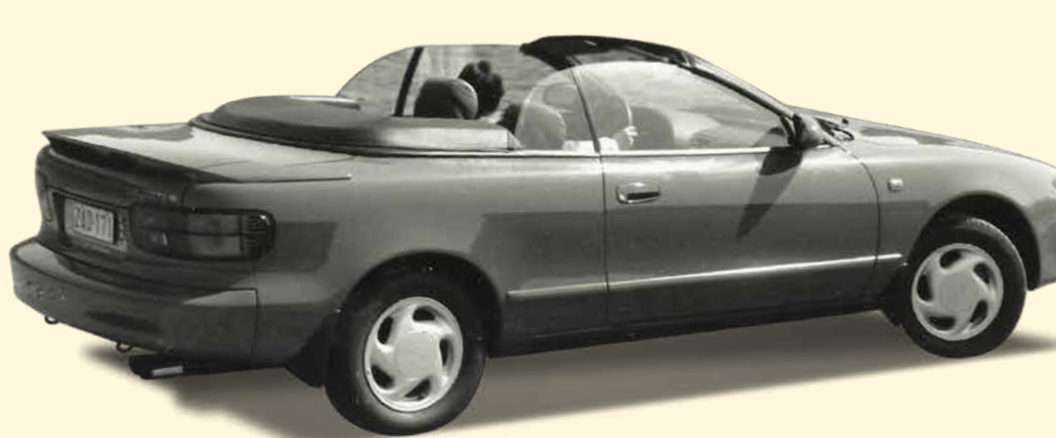
België ontdekt de Toyota Celica cabrio