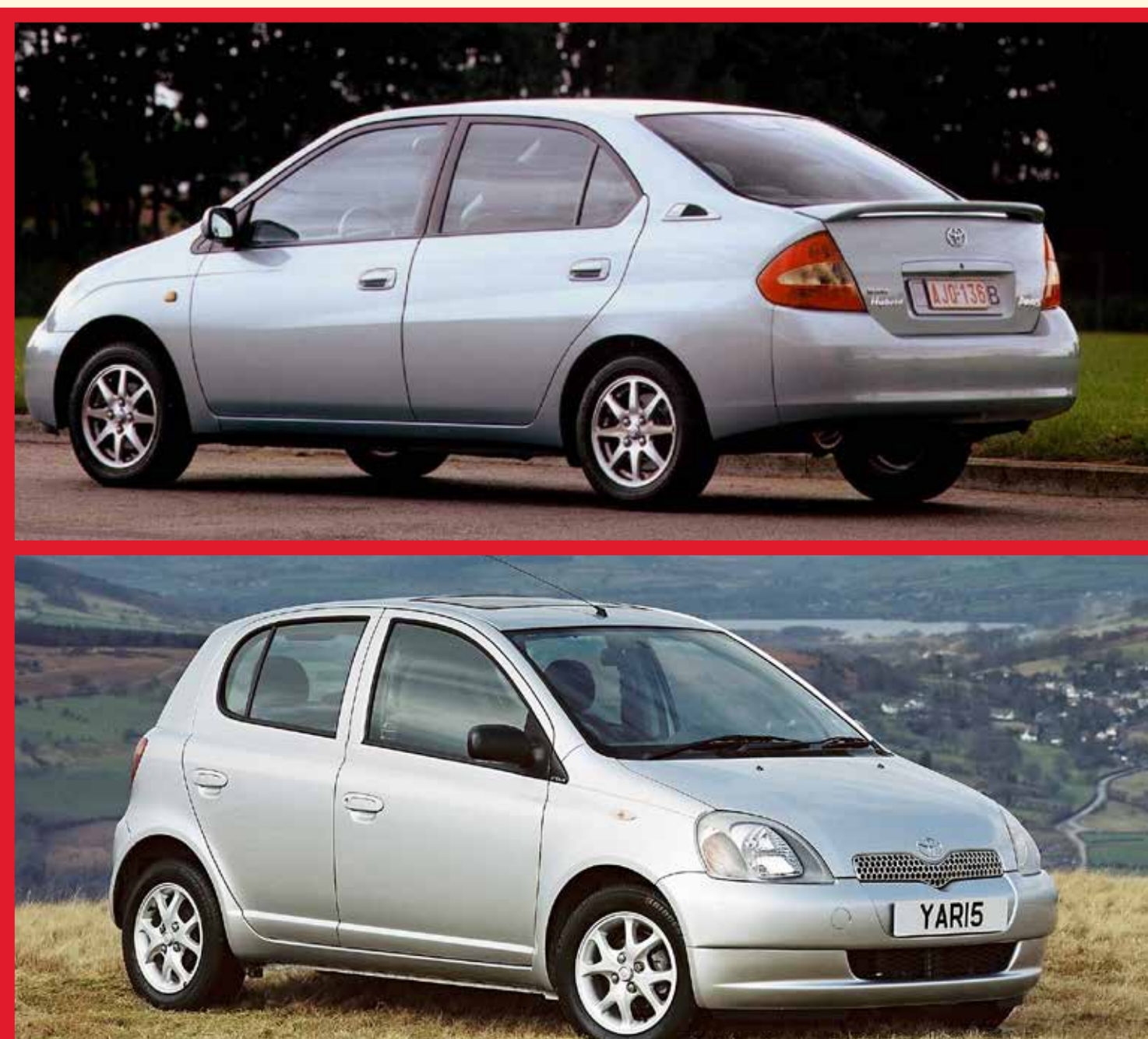
De hybride Toyota Prius verschijnt op de Belgische wegen. De Yaris (1999) wordt verkozen tot Auto van het Jaar