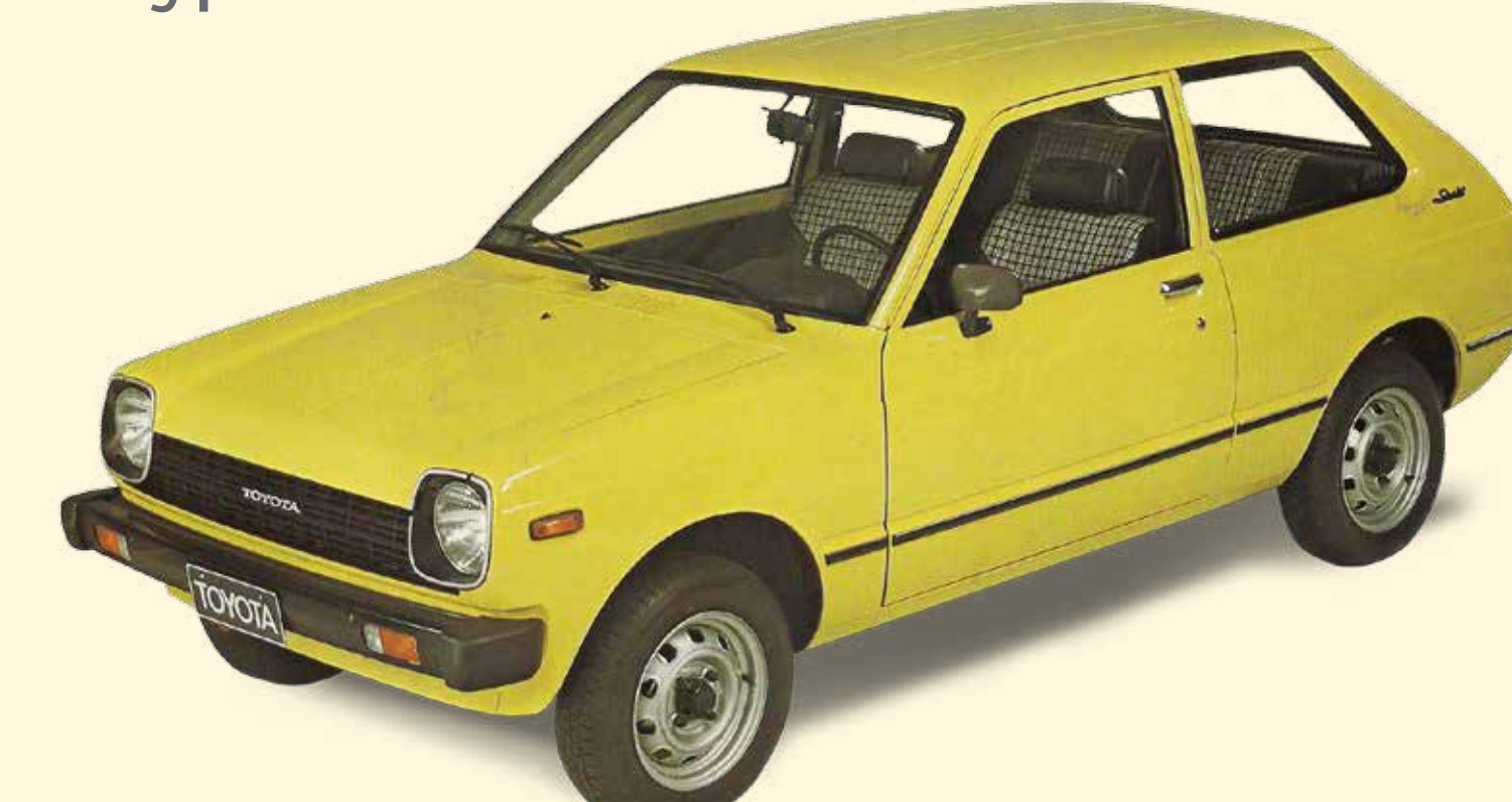
De Toyota Starlet verschijnt op de markt

Belgische vedetten waarden de prestaties van Toyota tijdens internationale rallyproeven