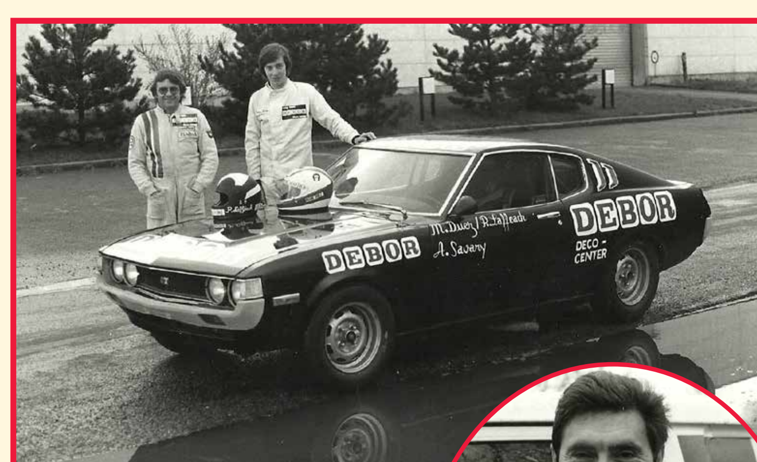
Eddy Merckx, Jacky Ickx, Paul Van Himst...

Belgische vedetten waarden de prestaties van Toyota tijdens internationale rallyproeven