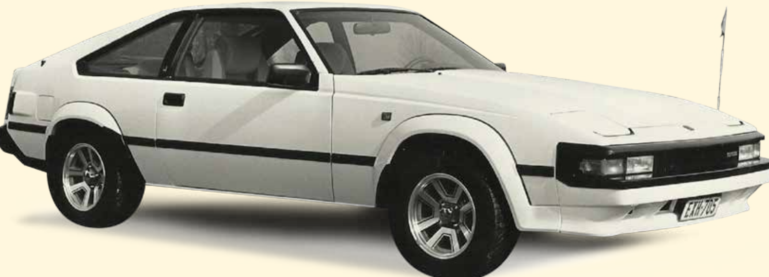
Toyota Supra (170 pk 6 cilinder)