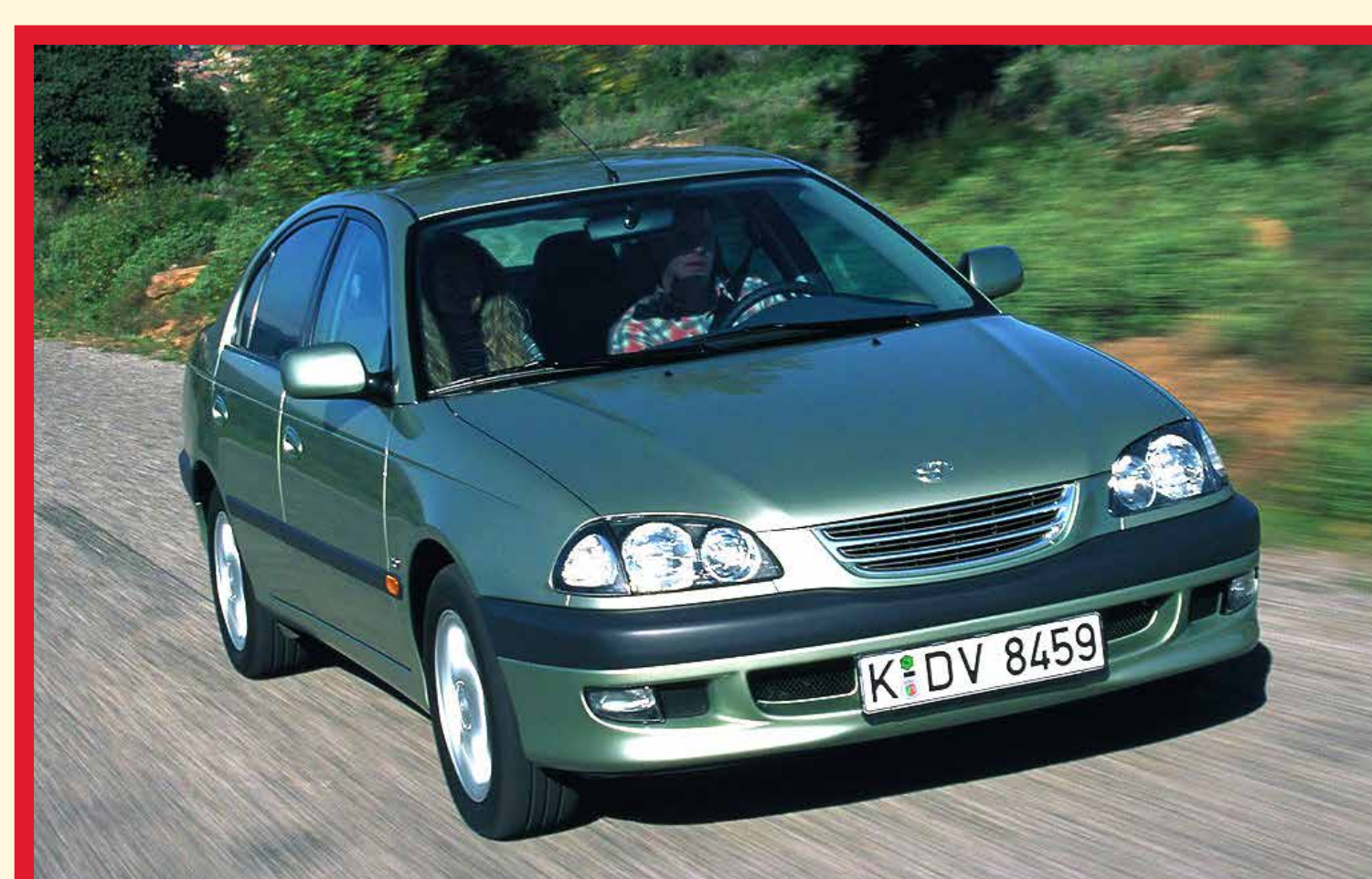
De Toyota Avensis wordt verkozen tot Lease Car of the Year

Inhuldiging van de nieuwe maatschappelijke zetel en het technische en administratieve centrum in Eigenbrakel (oppervlakte: 14.000 m 2 )