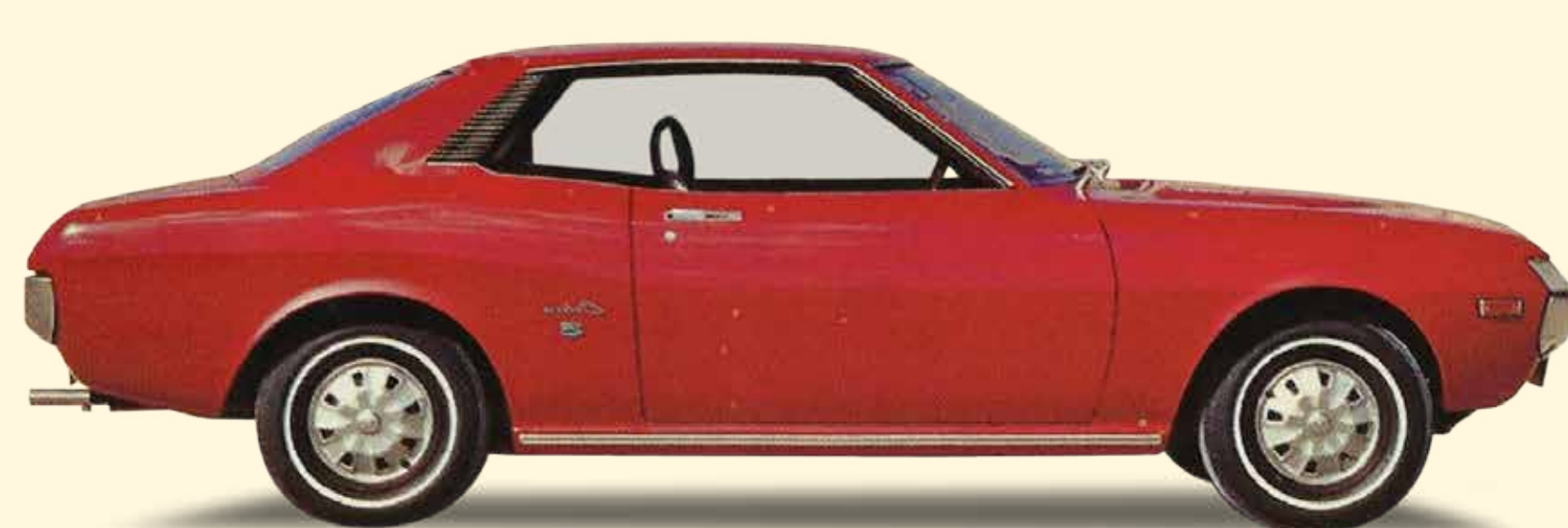
De nieuwe modellen Celica en Carina worden op de markt gebracht