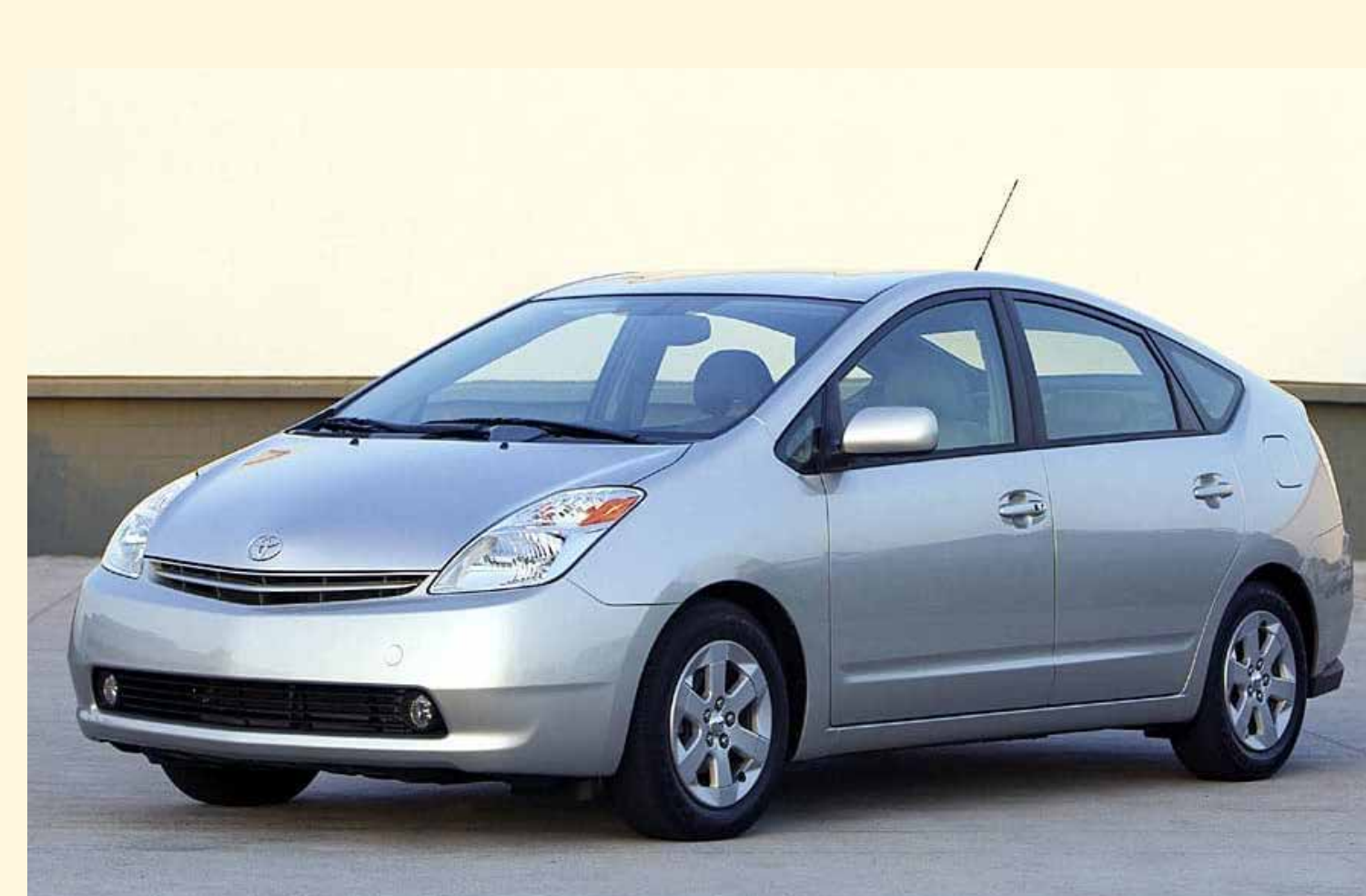
De Prius wordt verkozen tot Auto van het Jaar

Toyota neemt de kaap van 1.000.000 verkochte voertuigen