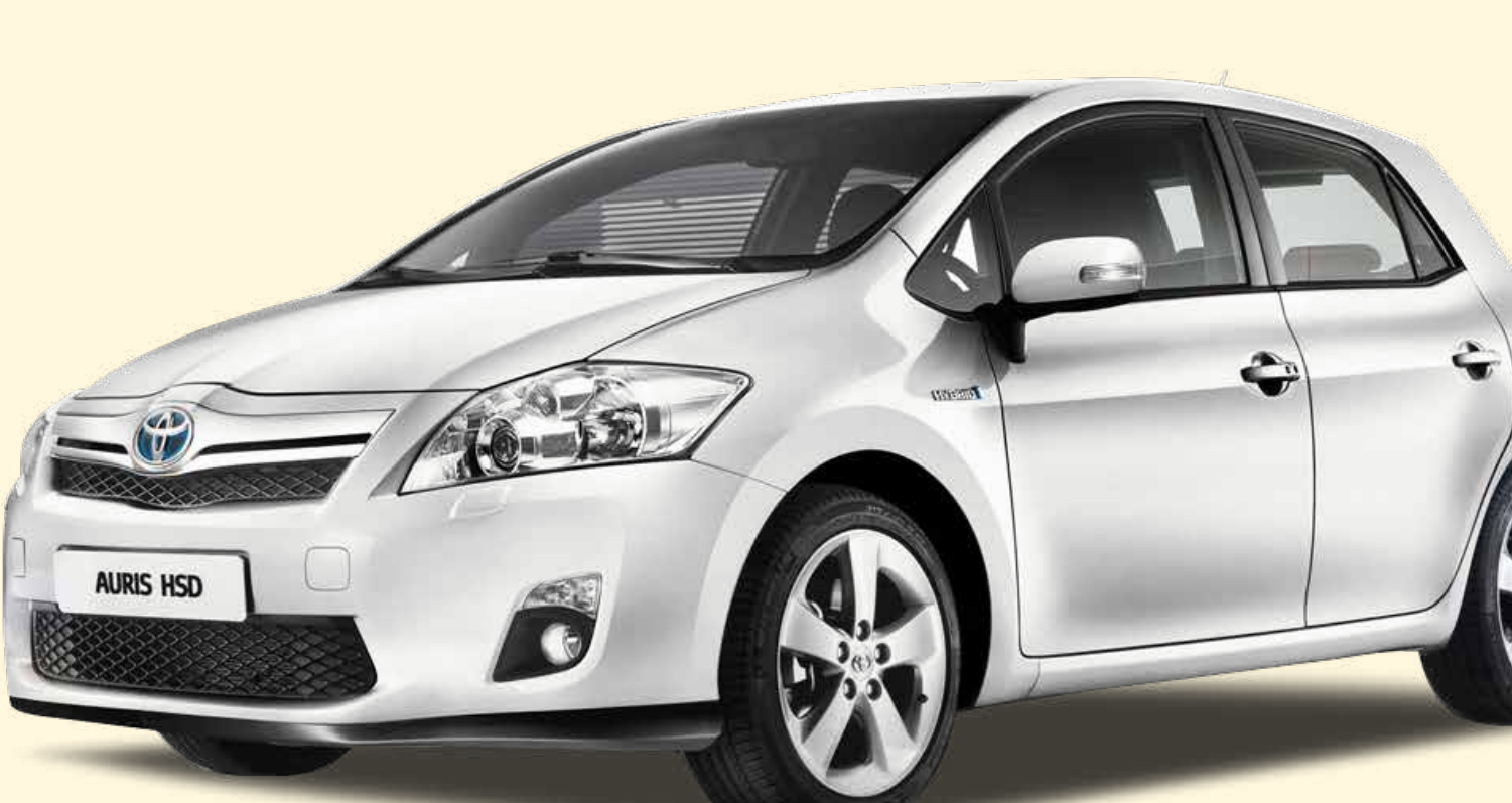
De Auris hybride komt op de markt

Een op de vier verkochte Toyota's is een hybridemodel