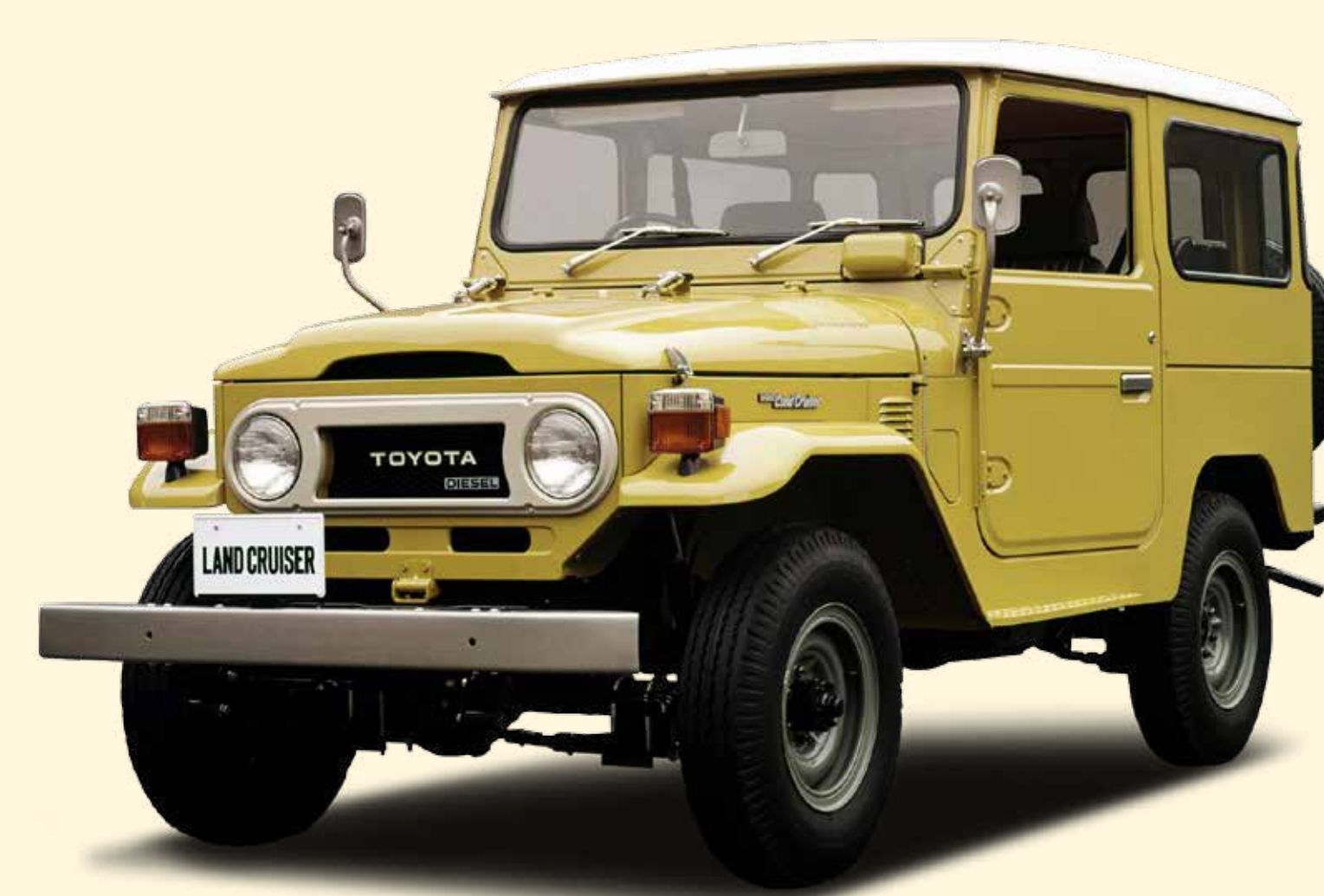
Lancering van de Toyota Land Cruiser