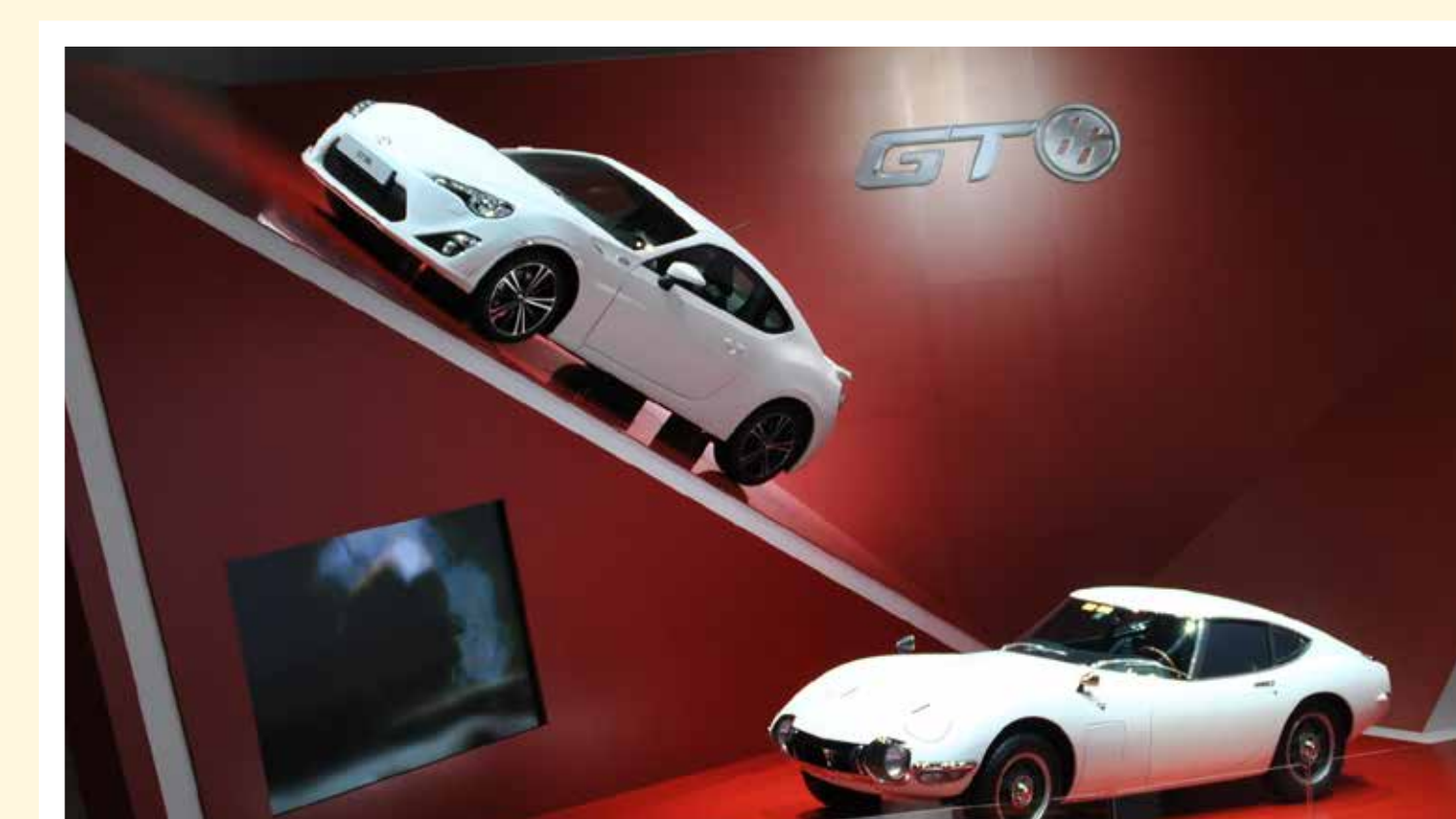
Sportiviteit troef met de Toyota GT 86 en de 2000 GT