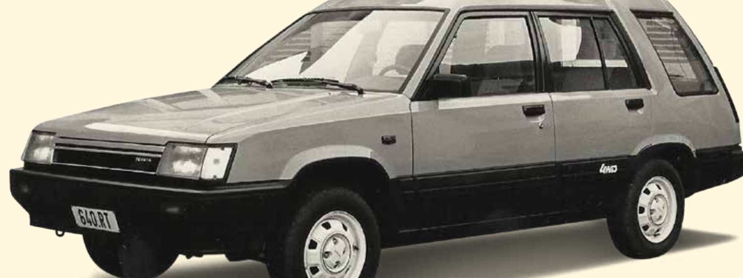
Lancering van de eerste vierwielgedreven Toyota Tercel 4x4 op de Belgische markt