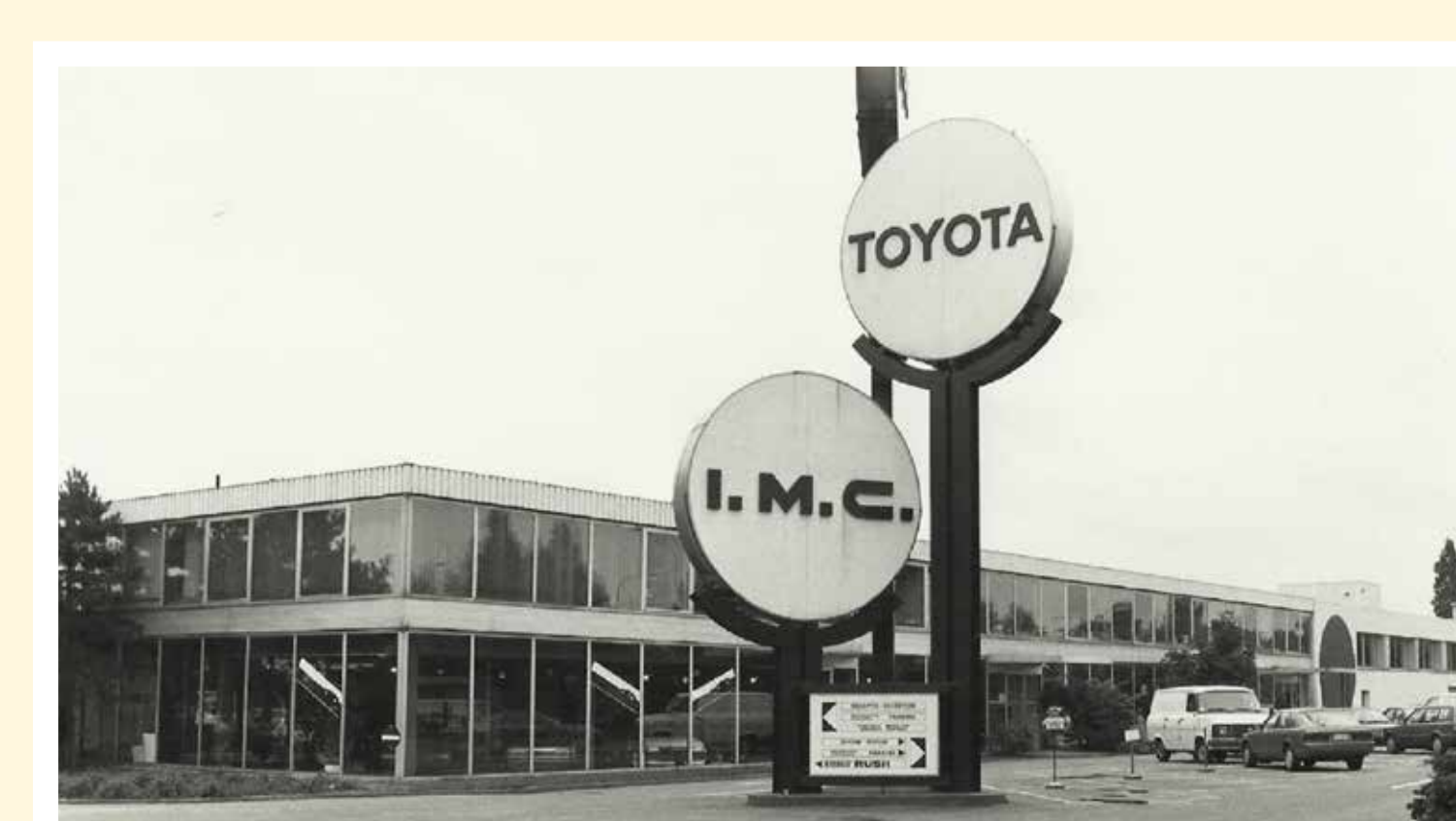
IMC (International Motor Company) vestigt zich in Diegem