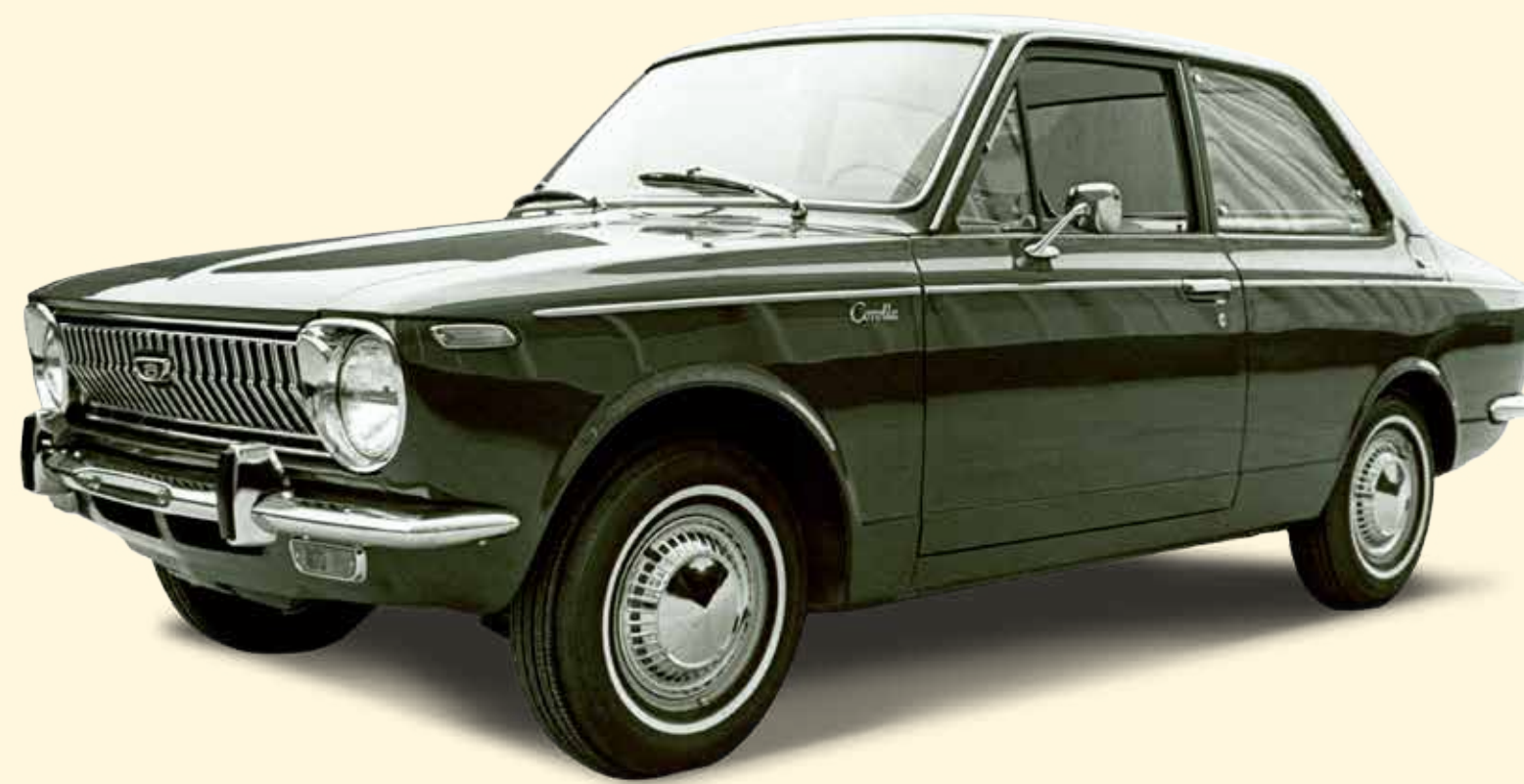
Toyota neemt voor het eerst deel aan het Salon van Brussel en brengt het model Corolla op de markt.