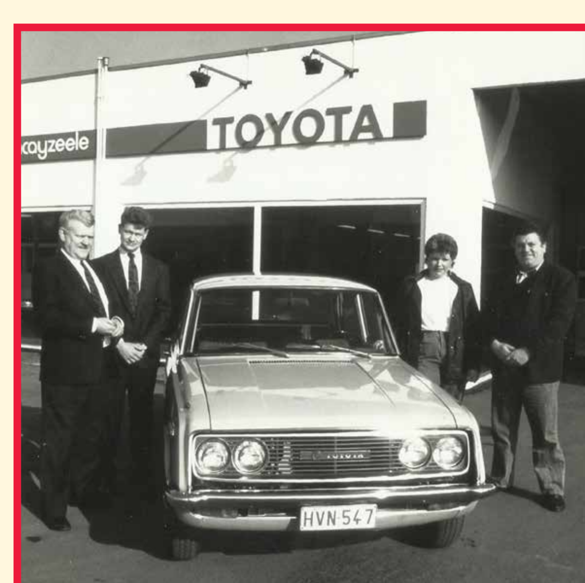
De eerste Belgische klant neemt zijn Toyota Corona in ontvangst