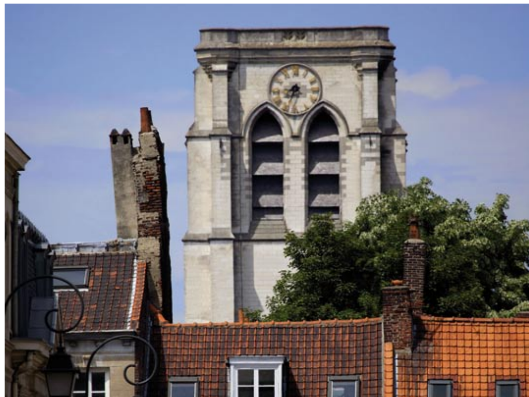
Eglise Sainte Catherine

“ Le parvis Sainte-Catherine est une place particulièrement calme et agréable du Vieux-Lille. Cette église abrite Marie, la plus ancienne cloche de Lille, qui donne le mi. Un son qui nous accompagne dans le jardin du Clarence à l'heure du thé. Sous la voûte lambrissée de sapin, les boiseries, tableaux et sculptures sont de véritables merveilles, tout comme l'orgue datant de 1687 et la chaire sculptée du XVIII ème siècle. ”