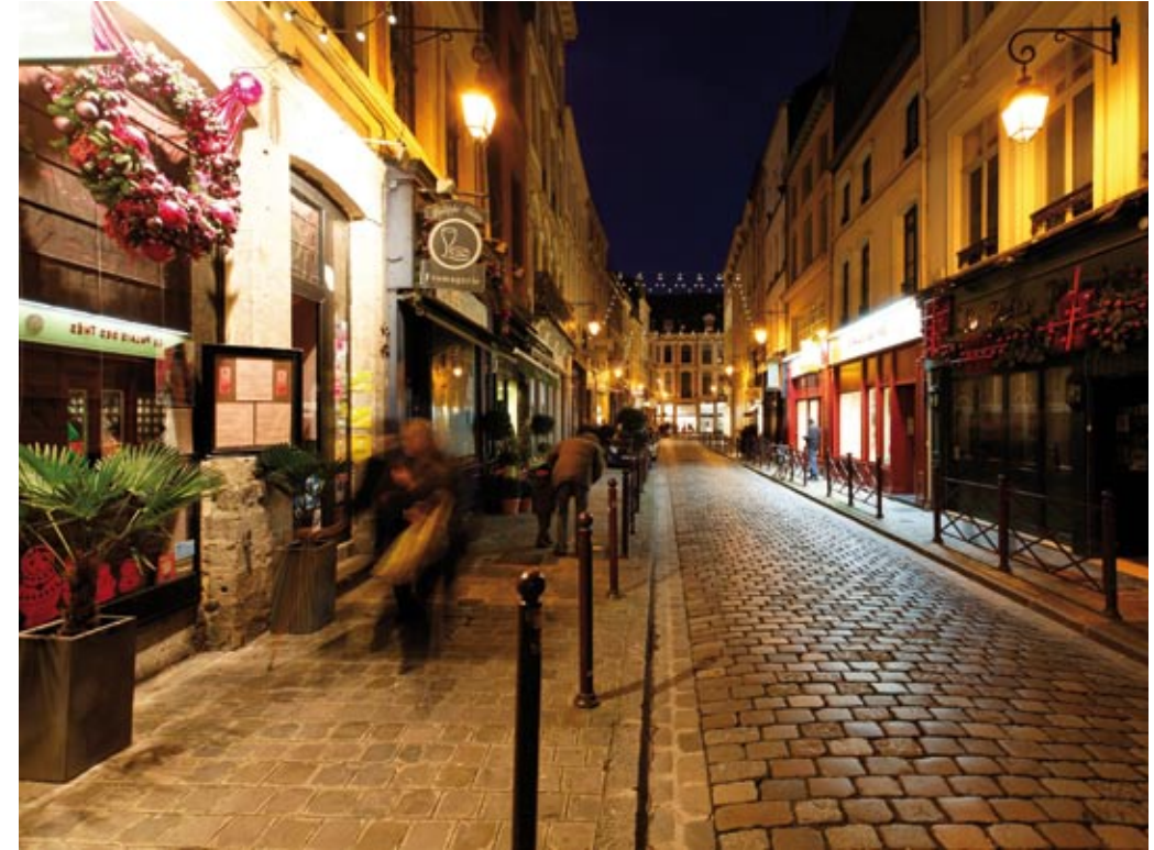
Rue du Curé St Etienne

“ J'aime déambuler dans ce quartier, le plus pittoresque de la ville. Entre la Grand Place et la cathédrale Notre-Dame de la Treille, je flâne dans les boutiques, galeries d'art, cafés et restaurants. Ses ruelles pavées suivent le tracé des canaux aujourd'hui disparus. Dans le quartier Royal, qui s'étend de l'ouest de la cathédrale jusqu'au canal de la Deûle, j'admire les demeures aristocratiques et les hôtels particuliers à la française qui longent ses rues. ”