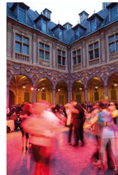
Bal Tango

“ Pour moi, la Vieille Bourse est incontestablement le plus beau monument de la ville avec sa façade typique flamande. Riche en symboles, ce bâtiment est en réalité composé de 24 maisons identiques construites autour d'une cour à arcades. Comme pour le Clarence, la Vieille Bourse a connu sa renaissance dans les années 90 grâce au mécénat d'entreprises régionales. J'aime m'y balader les dimanches après-midi pour profiter du marché de livres d'occasion et admirer, dès le mois de juillet, les danseurs de tango. ”