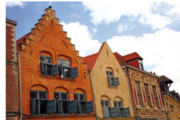
Place Louise de Bettignies

“ J'aime déambuler dans ce quartier, le plus pittoresque de la ville. Entre la Grand Place et la cathédrale Notre-Dame de la Treille, je flâne dans les boutiques, galeries d'art, cafés et restaurants. Ses ruelles pavées suivent le tracé des canaux aujourd'hui disparus. Dans le quartier Royal, qui s'étend de l'ouest de la cathédrale jusqu'au canal de la Deûle, j'admire les demeures aristocratiques et les hôtels particuliers à la française qui longent ses rues. ”