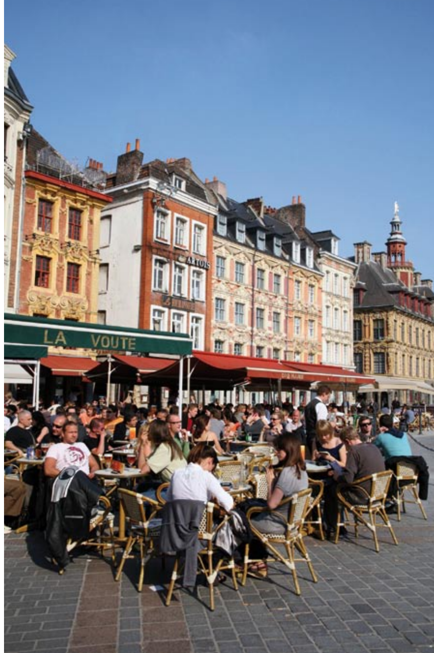
Terrasse Grand Place

Clarance, Aurélie, Nicolas,... Réels ou imaginaires, originaires ou non de la région, tous sont devenus nordistes de cœur. Aussi hétéroclite que cosmopolite, dans une région reconnue pour sa convivialité, Lille ne laisse personne indifférent. Idéalement situé à l'entrée du Vieux-Lille et à proximité immédiate de la Grand Place et de la Citadelle, le Clarance est le point de départ idéal pour une visite de la ville. L'équipe du Clarance présente, sur le ton de la confiance, son parcours intime et ses bonnes adresses.