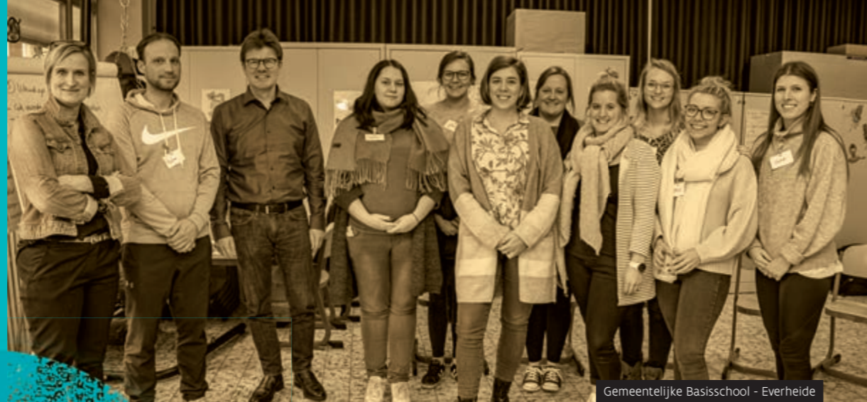
Gemeentelijke Basisschool - Everheide