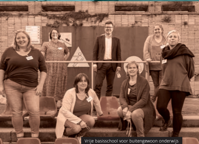
Vrije basisschool voor buitengewoon onderwijs