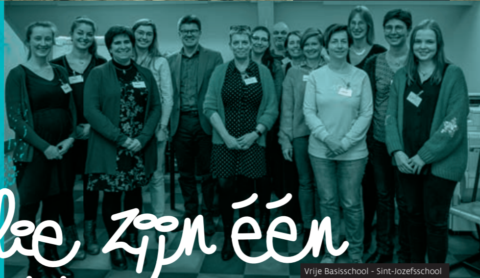
Vrije Basisschool - Sint-Jozefsschool