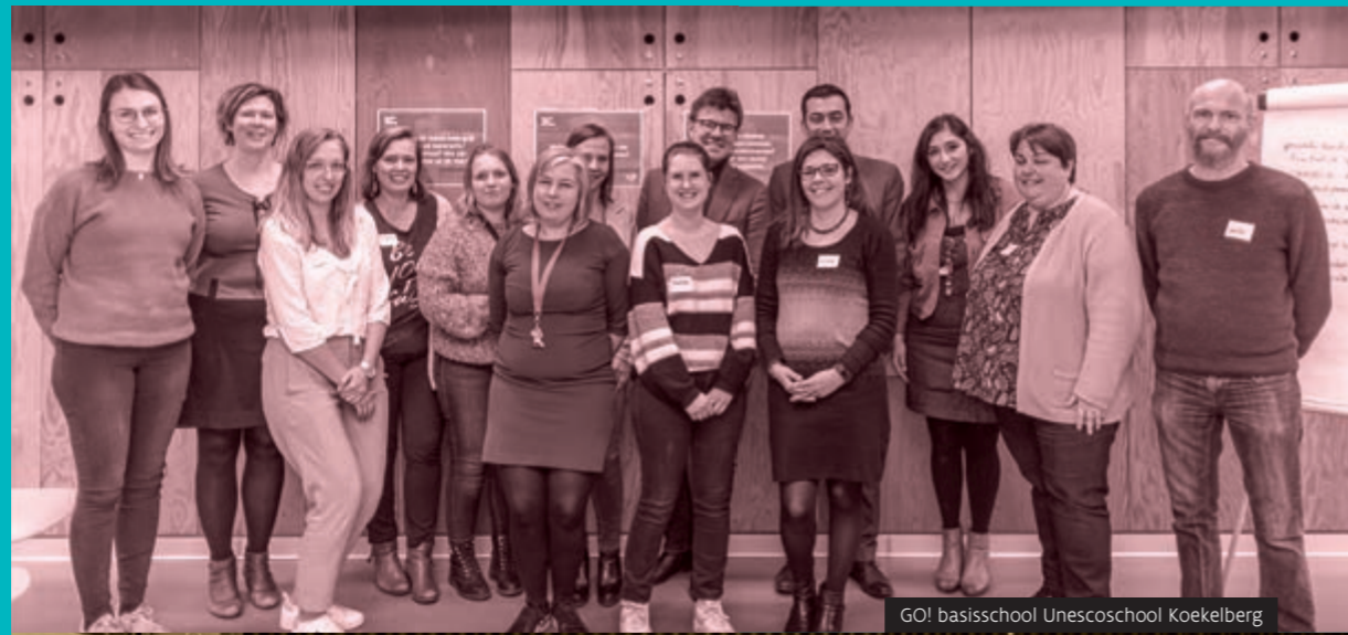
GO! basisschool Unescoschool Koekelberg