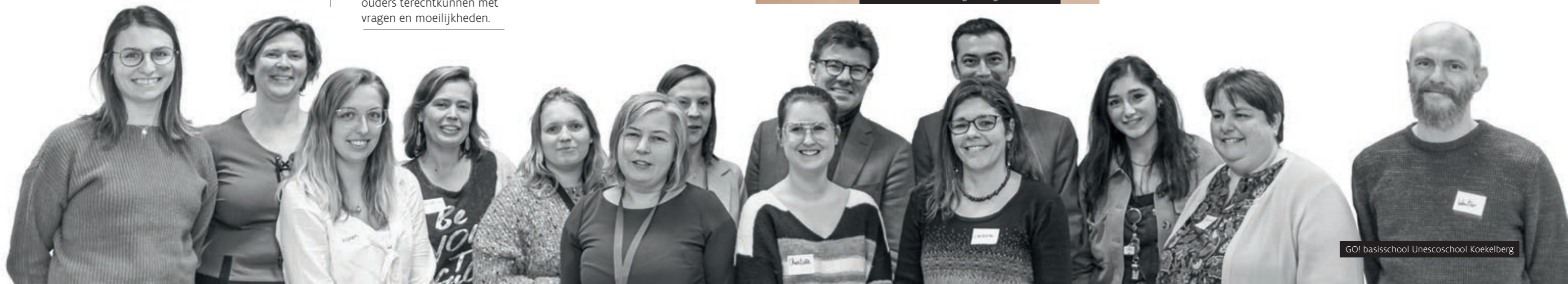
GO! basisschool Unescoschool Koekelberg

– Leerkracht, GO! basisschool Zavelberg Sint-Agatha-Berchem