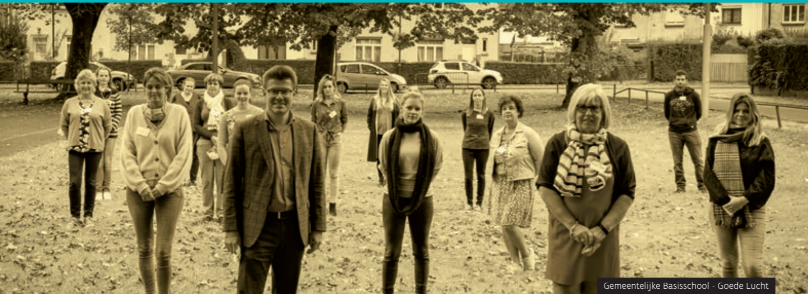
Gemeentelijke Basisschool - Goede Lucht