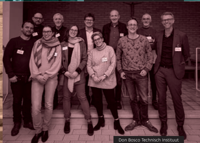
Don Bosco Technisch Instituut

Wat zijn de grote werkpunten voor het Nederlandstalig onderwijs in Brussel? De uitnodiging van de VGC om hierover mee na te denken, kon op veel sympathie en medewerking rekenen in de scholen!