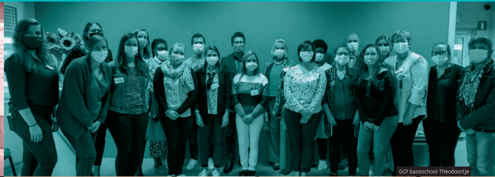
GO! basisschool Theodoortje