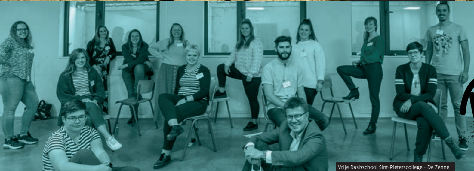
Vrije Basisschool Sint-Pieterscollege - De Zenne