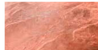
Copper metallic/Métallisée (R3C)