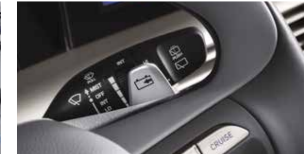
Paddle shift (freinage régénératif)