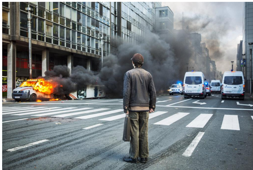
Protestation gilets jaunes – Dieter Telemans