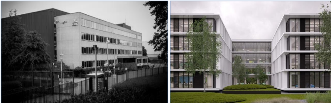
Kantoorruimtes voor en na.

De werken starten deze maand en zullen duren tot eind 2015.