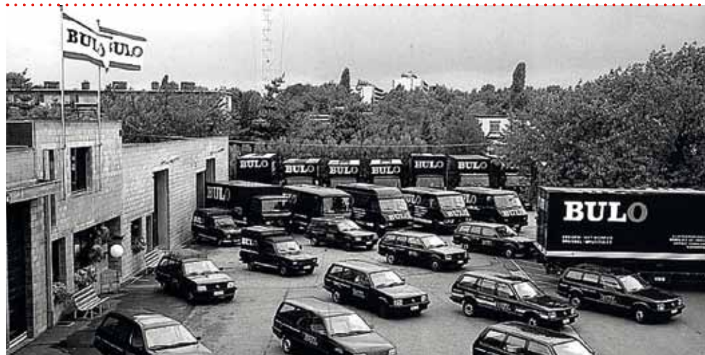
Een opmerkelijke marketingcampagne waarbij mensen een gratis 'Bulo'-verfbeurt voor hun voertuigen aangeboden krijgen. Het merk domineert zo jarenlang de Belgische autowegen met iconische zwarte auto's.