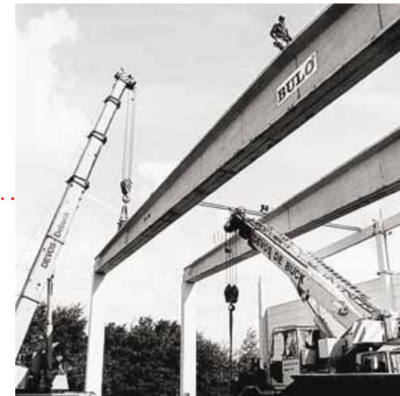
In twintig jaar tijd groeit Bulo uit tot het synoniem van kwalitatief kantoormeubilair. Het bedrijf bereidt zijn internationale groei voor en brengt in 1987 de verschillende diensten samen in een nieuwe hoofdzetel in Mechelen, op de industriezone Noord langs de E19, die Antwerpen met Brussel verbindt.