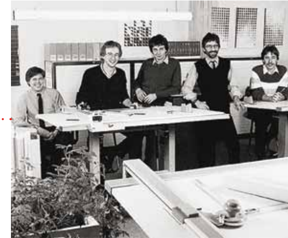
Bulo biedt een complete kantoorlook aan met alles erop en eraan: van bureaus en stoelen tot gordijnen, verlichting en planten.