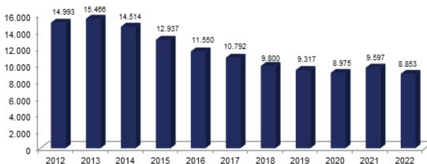
Nombre de jeunes chercheurs d'emploi (<25 ans) bruxellois pour le mois de janvier