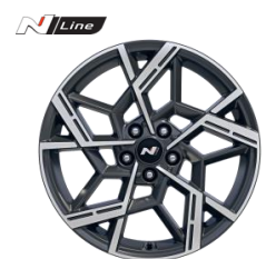
Jantes en alliage 19" N Line