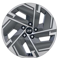
Jantes en alliage 17" Techno/Feel