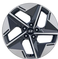
Jantes en alliage 18" Comfort