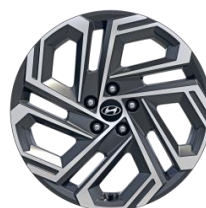
Jantes en alliage 19" Shine