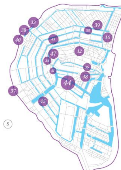
Cartographie olfactive d'Amsterdam