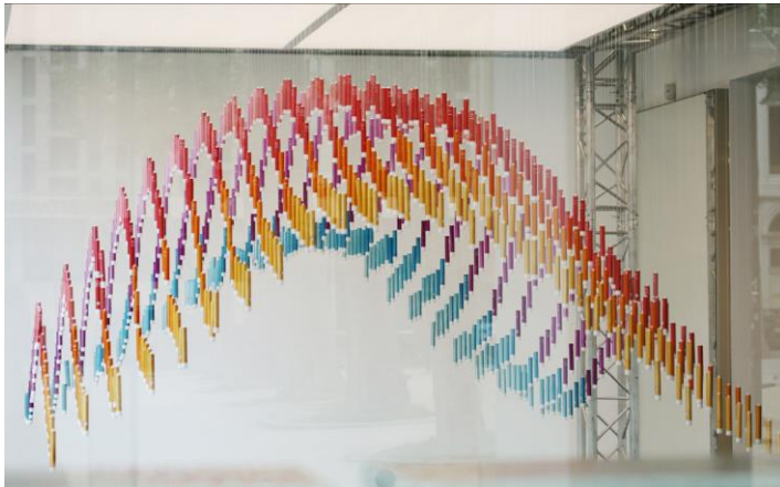
Installation éphémère « Scents of the City », rue Antoine Dansaert 90

Bruxelles, le 11 mai - du 12 au 14 mai, Thalys investit une galerie rue Antoine Dansaert en plein cœur de Bruxelles pour proposer un voyage olfactif à Paris, Bruxelles, Amsterdam et Cologne. Cette installation éphémère est la première séquence « in real life » d'une campagne de communication résolument sensorielle qui se déploiera largement online mais aussi dans les salles de cinéma.