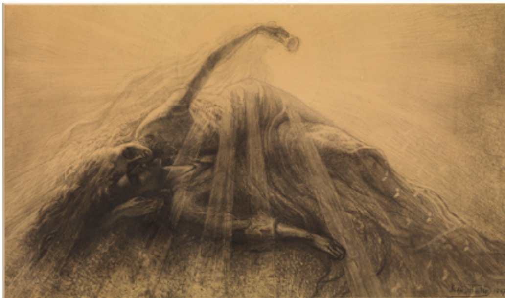
Jean Delville, Tristan et Yseult , 1887, crayon, craie noire, fusain sur papier, MRBAB, Bruxelles, inv. 7927 © SABAM Belgium / photo : J. Geleyns / Ro scan