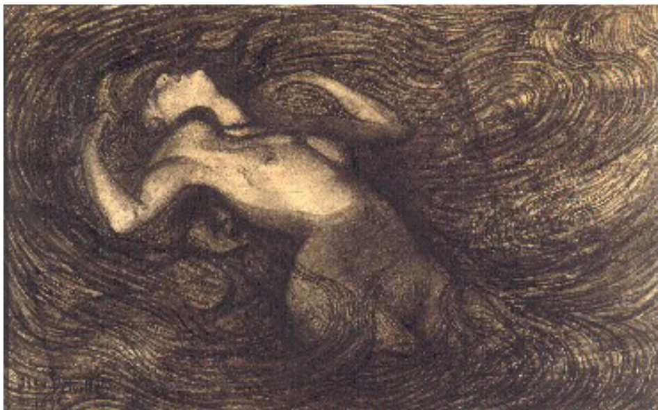
Jean Delville, Le cycle des passions , 1890, craie noire sur papier, MRBAB, Bruxelles, inv. 7926 © SABAM Belgium / Photo d'art Speltdoorn & Fils, Bruxelles