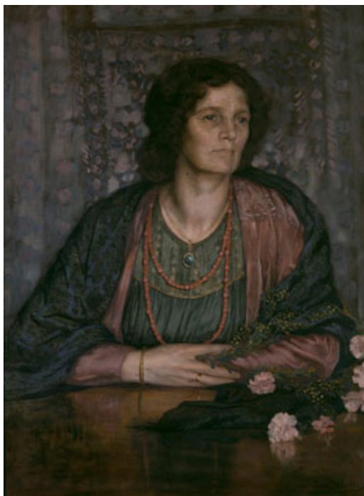
Jean Delville, Portrait de la femme de l'artiste , 1916, huile sur toile, MRBAB, Bruxelles, inv. 4878 © SABAM Belgium / Photo d'art Speltdoorn & Fils, Bruxelles