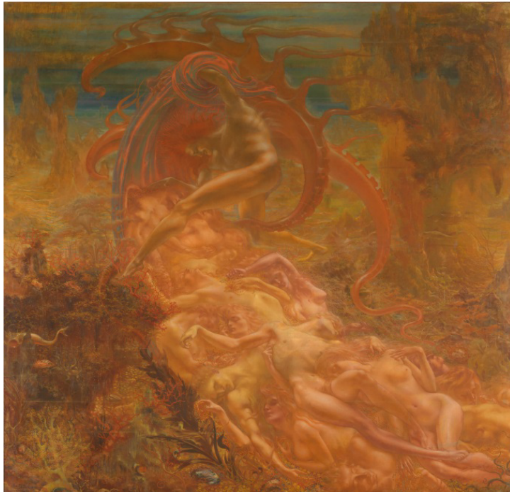
Jean Delville, Les trésors de Satan , 1895, huile sur toile, MRBAB, Bruxelles, inv. 4575, © SABAM Belgium / photo : J. Geleyns / Ro scan