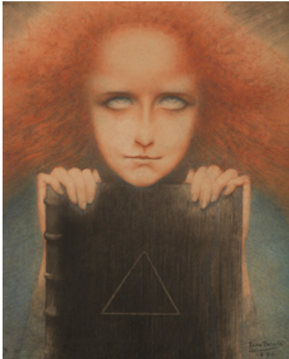
Jean Delville, Portrait de madame Stuart Merrill / Mysterosa , 1892, crayon, pastel et crayons de couleur sur papier, MRBAB, Bruxelles, inv. 12029