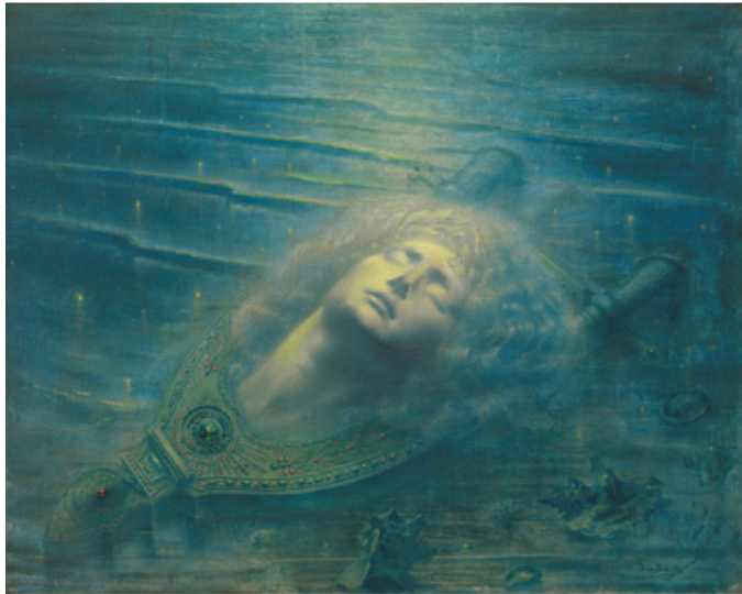
Jean Delville, Orphée mort , 1893, huile sur toile (rentoilée), MRBAB, Bruxelles, inv. 12209 [œuvre actuellement prêtée au Palazzo Reale, Milan]