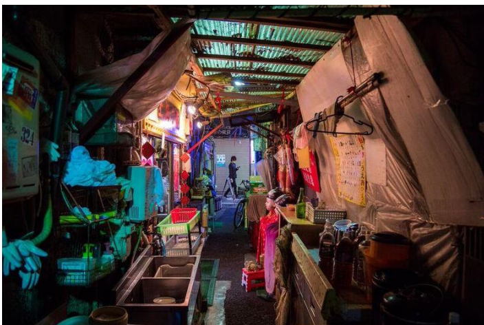
Lukasz Palka: D5, AF-S NIKKOR 24-120mm f/4G ED VR

De serie omvat niet alleen foto's van overstekende mensenmassa's op de Shibuya-kruising en van de 238 meter hoge Mori Toren, maar ook van boeddhistische monniken en het straatleven van Tokio.