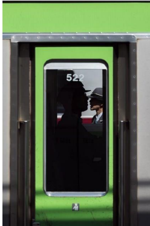
D5, AF-S NIKKOR 24-120mm f/4G ED VR

Fotografen die na het zien van de serie 'Cutting Through The Chaos' willen experimenteren en hun fotografie op hun volgende reis naar een hoger plan willen tillen, kunnen hier profiteren van cashback-voordeel op de allround zoomobjectieven van Nikon.