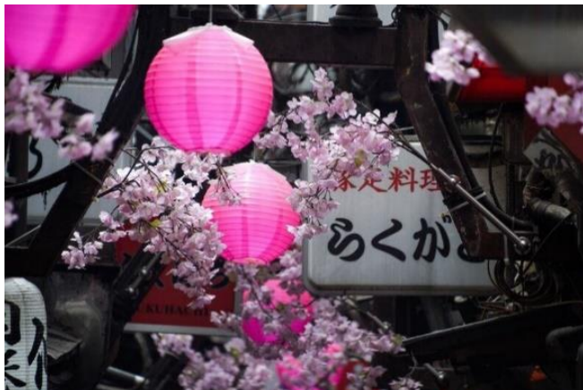
Lukasz Palka: D7500, AF-S DX NIKKOR 18-300mm f/3.5-6.3G ED VR

Fotografen die na het zien van de serie 'Cutting Through The Chaos' willen experimenteren en hun fotografie op hun volgende reis naar een hoger plan willen tillen, kunnen hier profiteren van cashback-voordeel op de allround zoomobjectieven van Nikon.