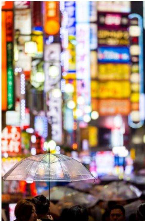
Lukasz Palka: D5, AF-S NIKKOR 80-400mm f/4.5-5.6G ED

Nikon Belux Bourgetlaan 50 1130 Brussel www.nikon.be