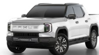
Pearl Lustre White